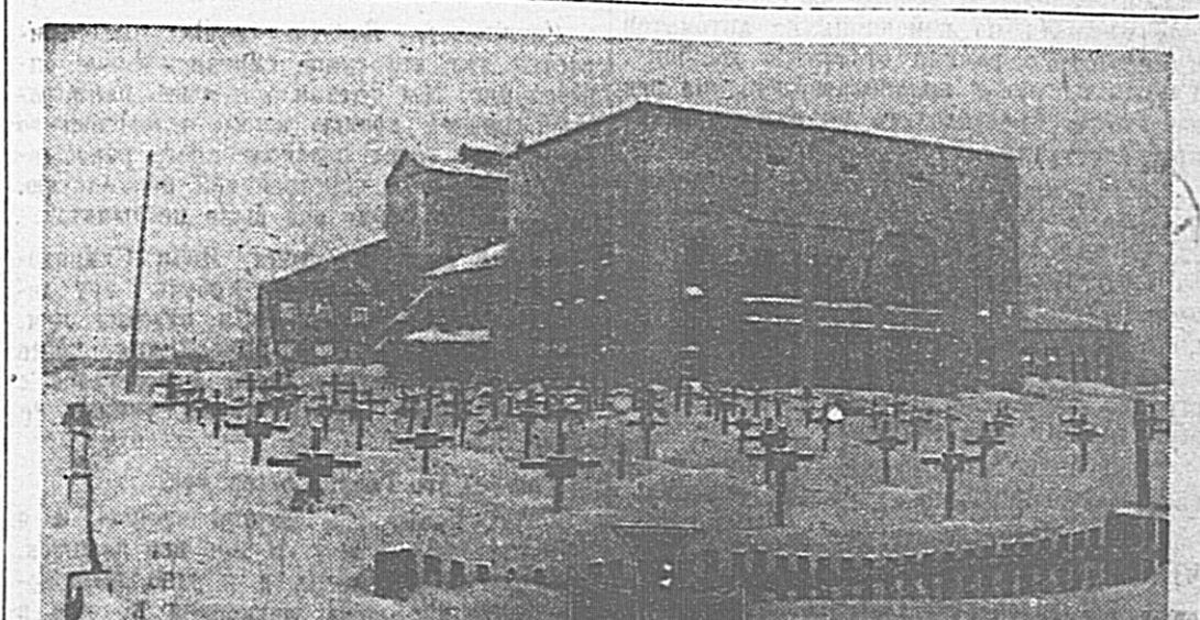
В освобожденной советскими войсками Лозовой (Юго-Западный фронт). Классные гитлеровских солдат у разрушенного фашистским громовиком Дома социалистической культуры.

150 комсомольцев Саткинского района делают инструмент для МТС и совхозов. Комсомольцы И-ского завода отгружат не менее 5 вагонов запасных частей для машинно-тракторных станций. Учащиеся ремесленного училища № 4 изготовят 50 новых плугов.