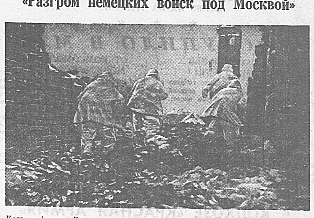
Кадр из фильма «Разгром немецких войск под Москвой». Советские автоматчики выбивают врага из населенного пункта.