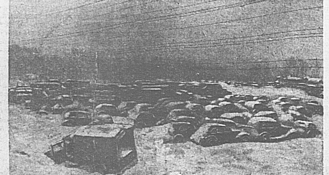
В освобожденной советскими войсками Лозовой (Юго-Западный фронт). Брошенные немцами во время бегства автомашины. Более 3 тысяч грузавиков, тягачей и штабных машин оставил враг в Лозовой.

ЕРЕВАН, 14 февраля. (ТАСС). Среда бойцов всеобщего развернувшегося соревнования в честь XXIV годовщины Красной Армии. 10 февраля во всех подразделениях начался систематическая тренировка по условиям программы соревнования.