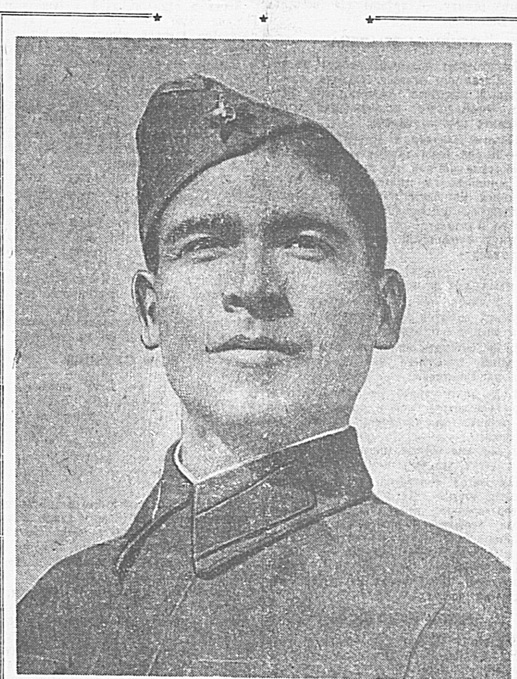
Воспитанник комсомола Туркмени, Герой Советского Союза КУРБАН-ДУРДЫ.