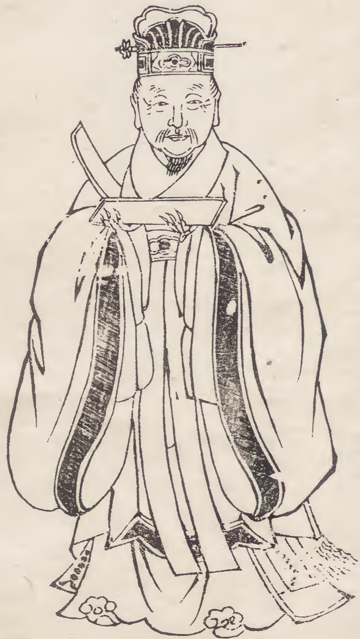
皇明狀元舒梓溪先生小像