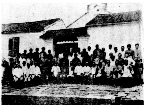
影攝會大民村巷里北

竹歡送。由此可見該團與村民感情融洽之一般矣。該團返蘇後。又于吳縣日報連出工作報告專刊兩天。概述全部工作之大略情形云。