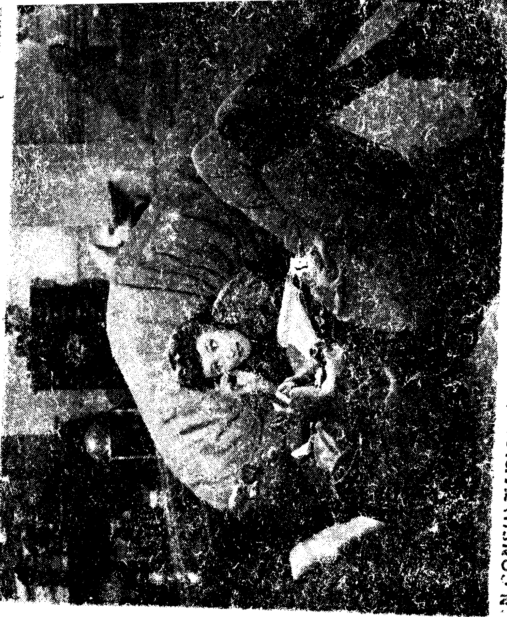
IN CONSULTATION the King likes to lie on the floor. Anna was a

ANNA AND THE KING become close friends and she tells him how to govern his state in a way to earn the respect of suspicious European countries