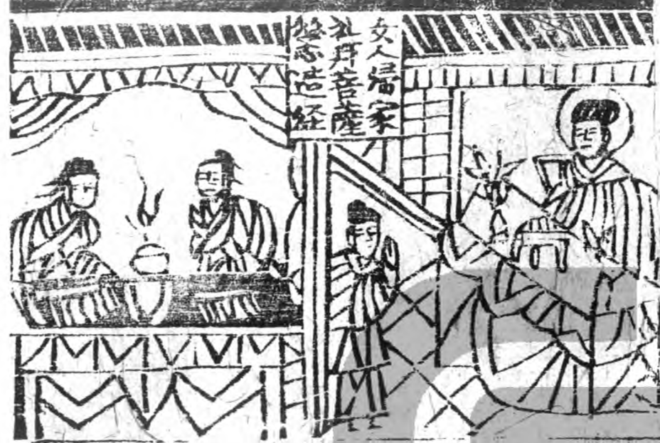
女人歸家 禮拜菩薩 經卷之經