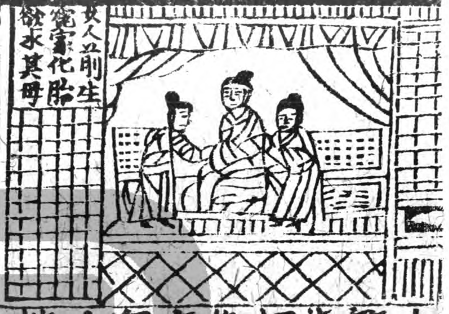
女人以前生 冤家化胎 欲求其母

中抱母心肝今慈母去生產之時分 解不得乃死乃生及至生產下來端正 如法不過兩歲即便身亡母憶之痛 切號哭遂即抱此孩兒拋棄向水中 如是三遍託蔭此身向母腹中欲求 方便置殺其母至第三遍準前得生 向母胎中百千計較抱母心肝令其母 千生万死悶絕叫喚準前得生下持 地端嚴相兒具足亦不過兩歲又以