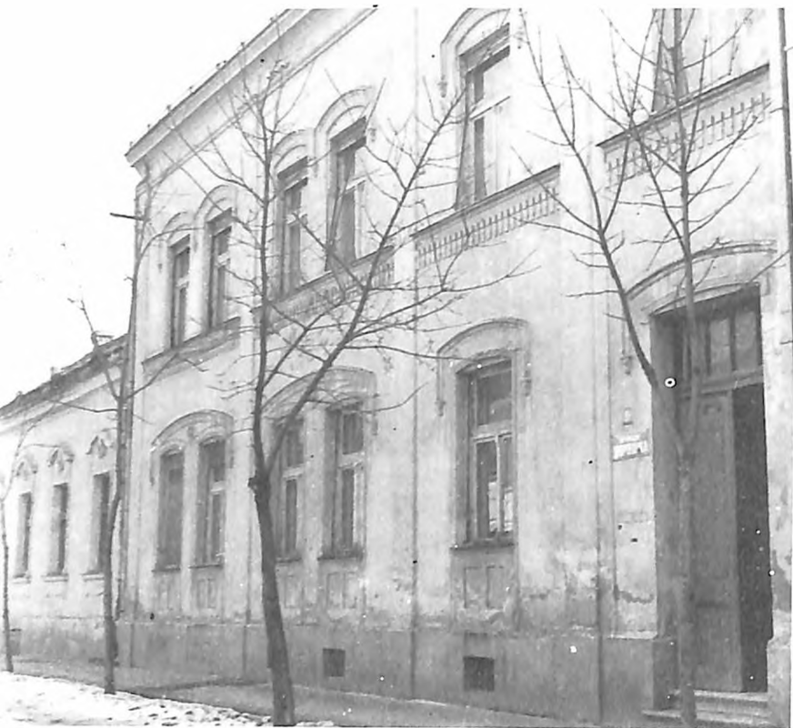
Zgrada Mildara u Solunskoj ulici