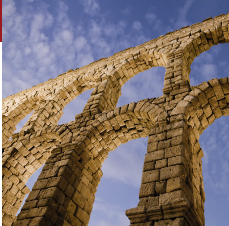
Wiki Loves Monuments 2012: 2. Gewinner im internationalen Wettbewerb

Unterstütze auch Du mit Deinem Foto die Wikipedia!