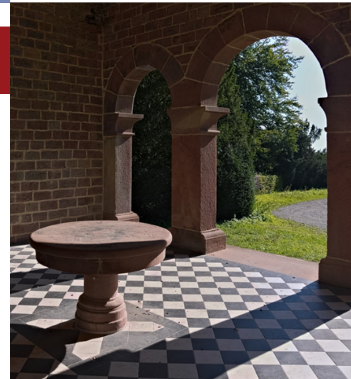
Wiki Loves Monuments 2012: 2. Gewinner im deutschen Wettbewerb