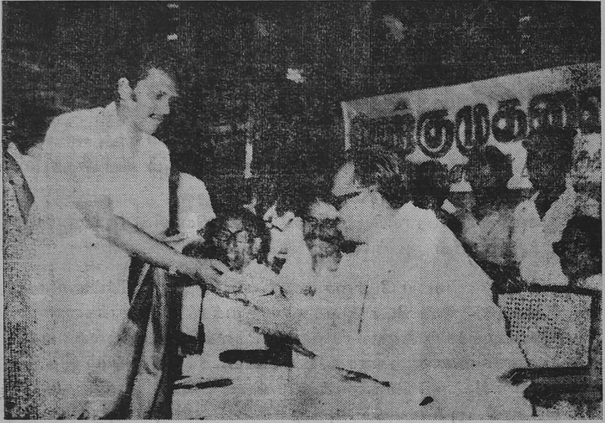
பேராசிரியர் அவர்கட்கு 'அண்ணாவின் கவிதைகள்' நூலை மாவட்ட இலக்கிய அணிச்செயலர் அளிக்கின்றார்.