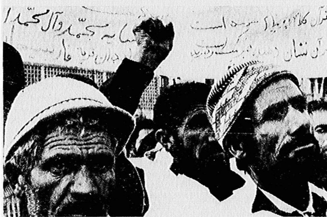
این چهره رنج دیده و خشمگین دهقانان فارسبجان فراهان اراک است، فریاد می زنند: صد ها هزار کشته، صد ها هزار زخمی، دیگر نباید سازش ...