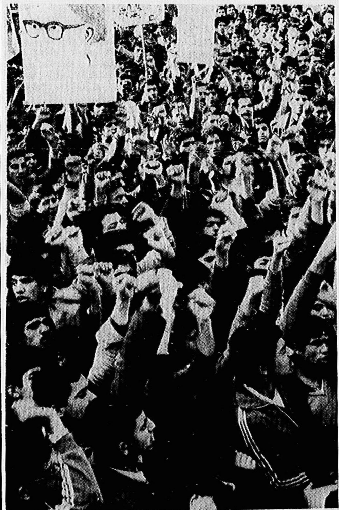
این صف عظیم دانش آموزان است. دانش آموزان مدرسه راهنمایی و دبیرستان سنایی (ناحیه ۵) با مشت های گره کرده آمریکا را محکوم می کنند.

با حضور صفوف دهقانان، جوانان، دانش آموزان، در مقابل لانه جاسوسی: