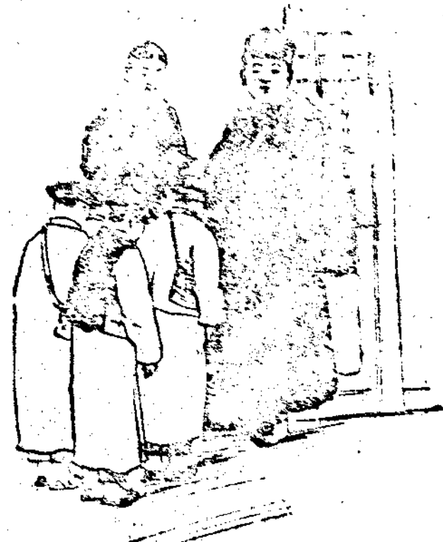
病勢如斯亦以體弱所至試服廉士大醫生紅色補丸人將亦信

過度思慮太甚是以療治腦虛頭痛以及各種腦系衰弱之症必須先為補血固精而後可也 廉士大醫生紅色補丸之所以能治愈千萬之患腦系衰弱者因是丸具有造血之奇功使血液充足而 腦筋得通身各部強健有力矣奉天高等學校校長張健平先生之證據足證廉士大醫生紅色補丸之功 力矣其家函云鄙人素患先天不足以致身體柔弱每若用心太甚即頭昏似痛非痛前一服即覺精神 健旺身不疲勞萬分重則寒熱頻來無定自知皆由體元虧弱之故後服此補品未幾十分功效而令 健使以學業心勞日瘳值至夏間精神爽頓飲食漸少殊以為憂適遇弟赴吉道適巧口彼時之