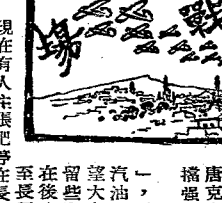
Caption for the illustration, describing the scene or person depicted.