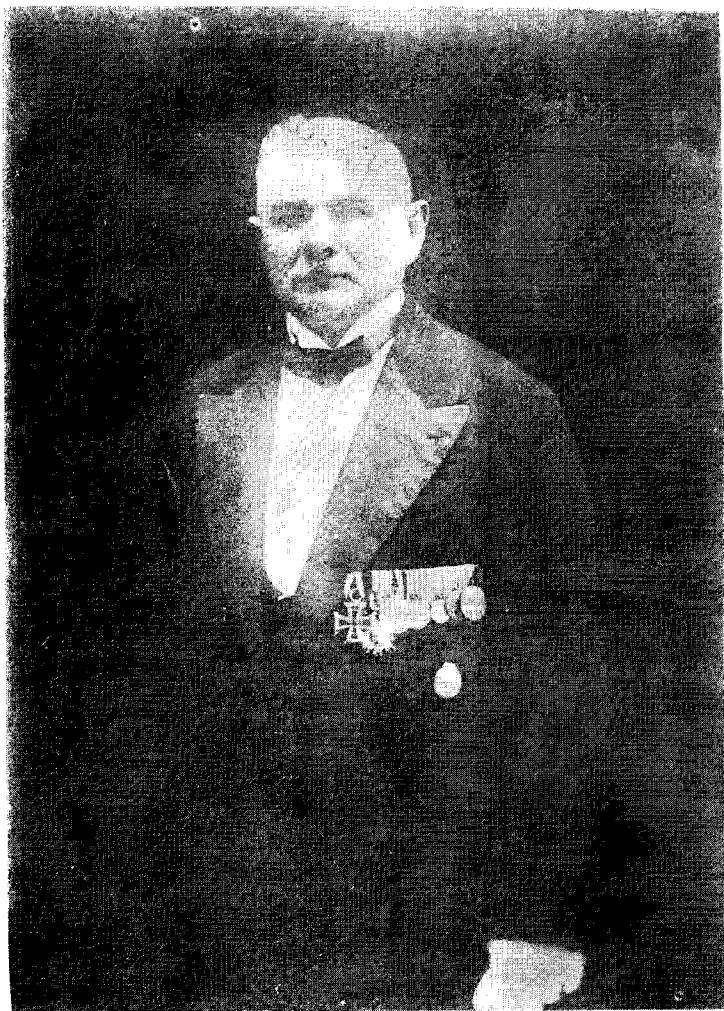
安 德 河