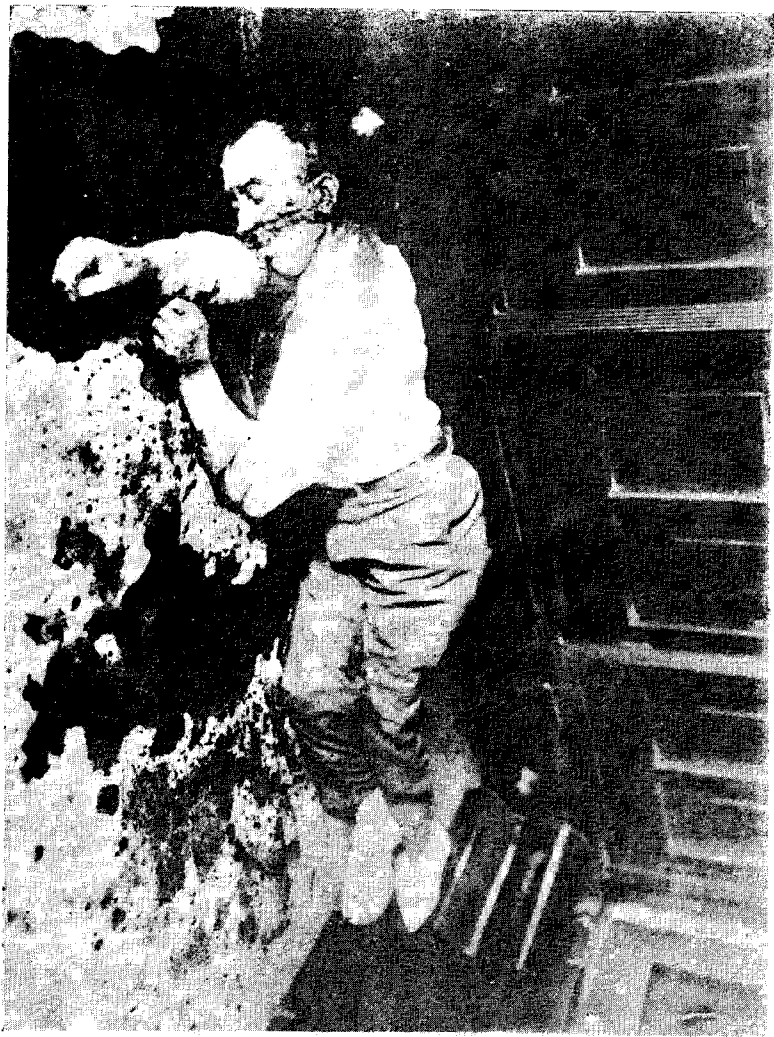
恆 師 斐 商 德 之 害 被 島 青