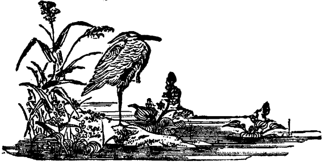
圖 書 館