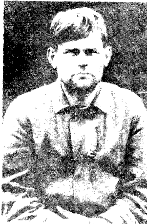
幾 次 列 瓦