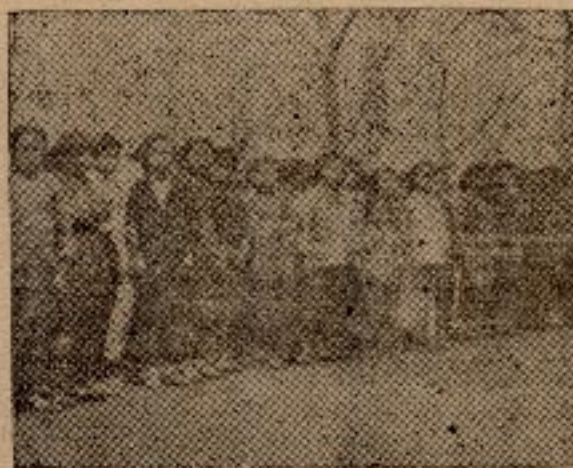
民衆夜校學生之一部

立之民衆夜校，又舉辦第四期招生矣。本期計劃，專收未讀過書的額限壹百名。向隅者衆，群皆泣求多量寬收。蓋彼等明知市府舉辦之民衆夜校開課已久，然而不往候聽此校，亦以此校辦理善，教法良，得益深、