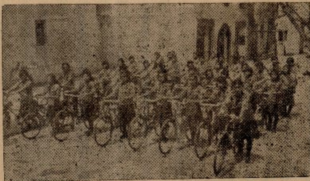
本 校 童 軍 單 車 旅 行

，本校初中一年級合社以上期班會會費之餘款購置自行車不足之數，由校補助之鼓勵其踴躍練習