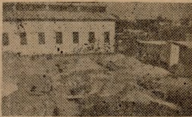
本校第一期校舍建築基地