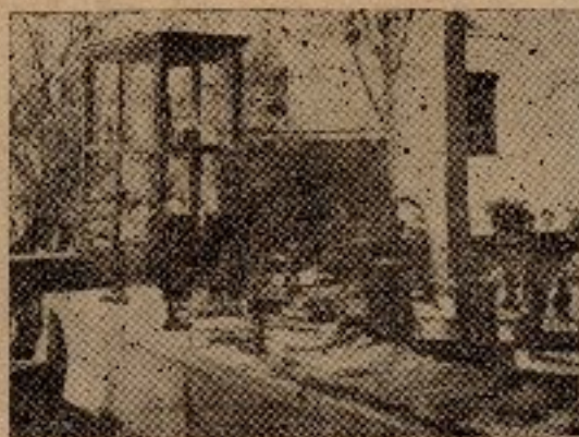
第一屆市教行政展覽會本校之一部

訓設計，教育圖解，自製標本及儀器，自編教材刊物，教育相片，其他行政及學生成績。十類，本校無不備齊，各有相當數量，尤特優異者為圖書目錄分類法，及公文歸檔分類法。此二者乃本校創用潮汕各地所無。合作社行政，與自治會立民衆夜校行政之完善尤稱佳異。至教育相片之多達四十件奇千餘幀更屬偉觀。