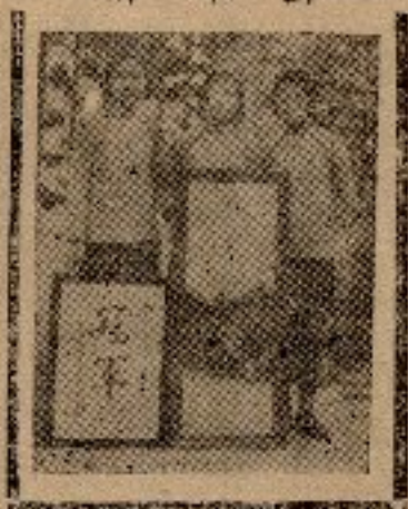
全市學生國語辯論會

十九日下午二時起假座青年會舉行。本校對一中，為一組，海濱對聿懷又為一組。一中正面，本