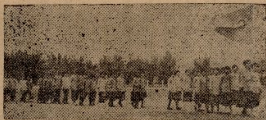
兒童節巡行本行附小之一部