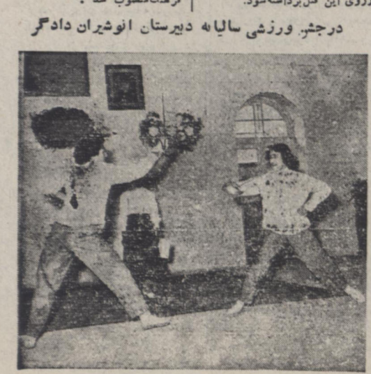
یک صحنه از نمایش شمشیر بازی بوسیله دو تن از دانش آموزان شرح در صحنه پنجم

کلانتری باغ صبا شهر مقتول را به فرمانداری نظامی تحویل داد تا شاید پرده از روی این قتل برداشته شود.