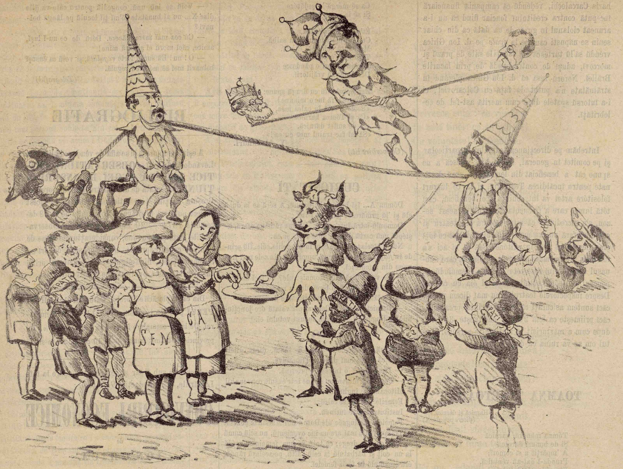
Echilibrul politic al marilor noștri pehlivanî.