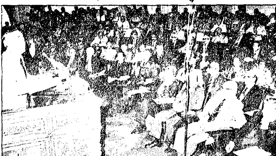
یزشک‌پور هنگام نطق در مجلس اعضاء هیات دولت در ردیف جلو نشسته‌اند.

پزشکیورده دولت کار خود را با قاننون شکنی آغاز کرد