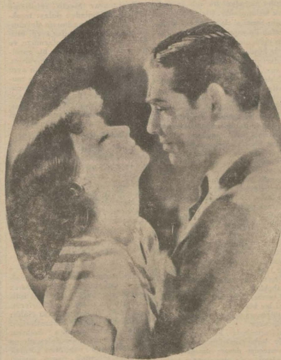
Greta ile Clark Gable "Kurtlan", filminde

Her kafadan bir ses çıkıyor. Yeni yeni şayialar..