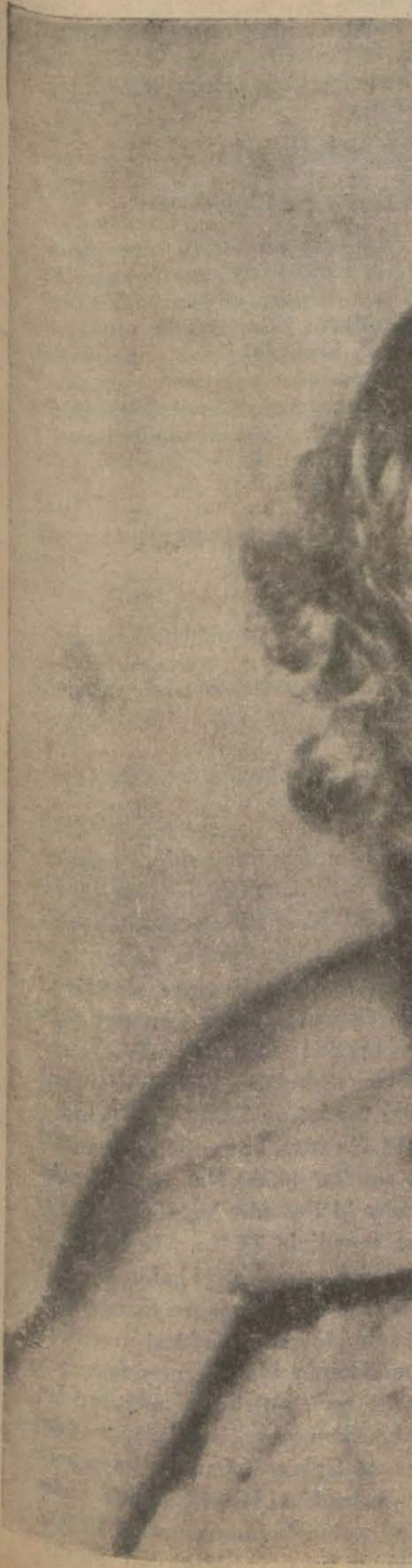
Amerikada en son çevirdiği "Sarışın rüya", filminde Lillian Harvey