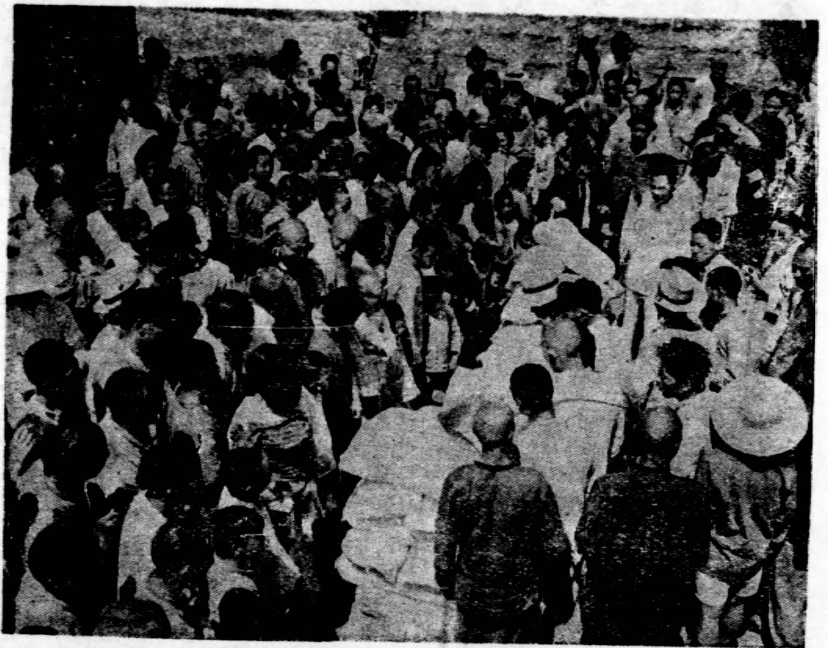
◀ 替 一 形 情 粉 發 署 分 本 ▶