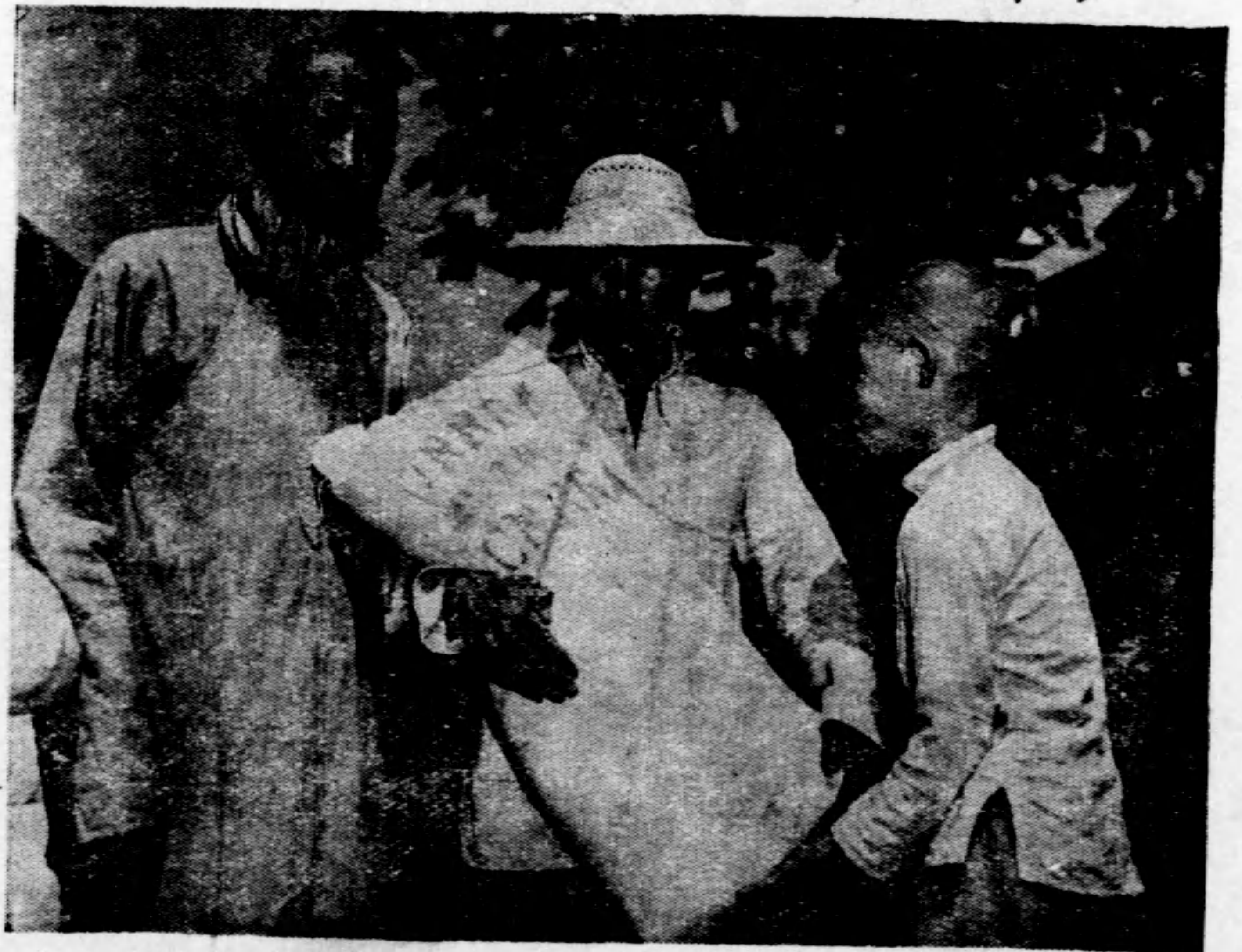
◀ 開 顏 逐 笑 父 祖 粉 麵 濟 救 得 領 孫 兜 ▶