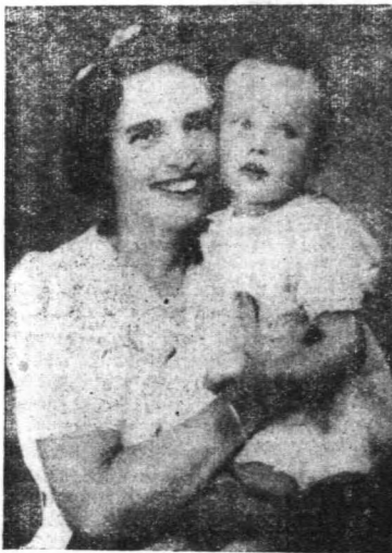
(趙小靈愛女幼其乃者抱手)照遺士女麗美冉陸

美國女士是美國人也是中國人。慕迪聖經學院及紐約某醫學院各修業一年。美麗女士一九三十年受美國北長老會傳道部的差派來中國傳道，在江蘇省蘇州縣服務鄉村佈道工作，共計六年，其中二年是住在一隻小船上（蘇州有運河四通八達到各鄉村，她藉着小船到各地工作都很便利）。她和她的中國朋友們合作，親手工作，在一處鄉下蓋造一所泥牆草屋，給四週農民作模範。她在那裏也住了兩年，把自己住的地方按照當地農民的經濟能力，佈置成標準家庭，行事為人，都顧到那些到她那裏來的農民，應付他們靈性上的需要。就是這六年蘇州鄉村佈道的生活，已足以表彰她一生救人歸主的心情。