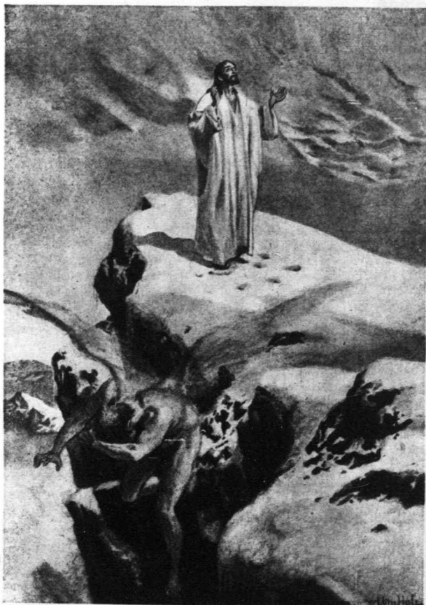
耶穌勝過撒但的探試