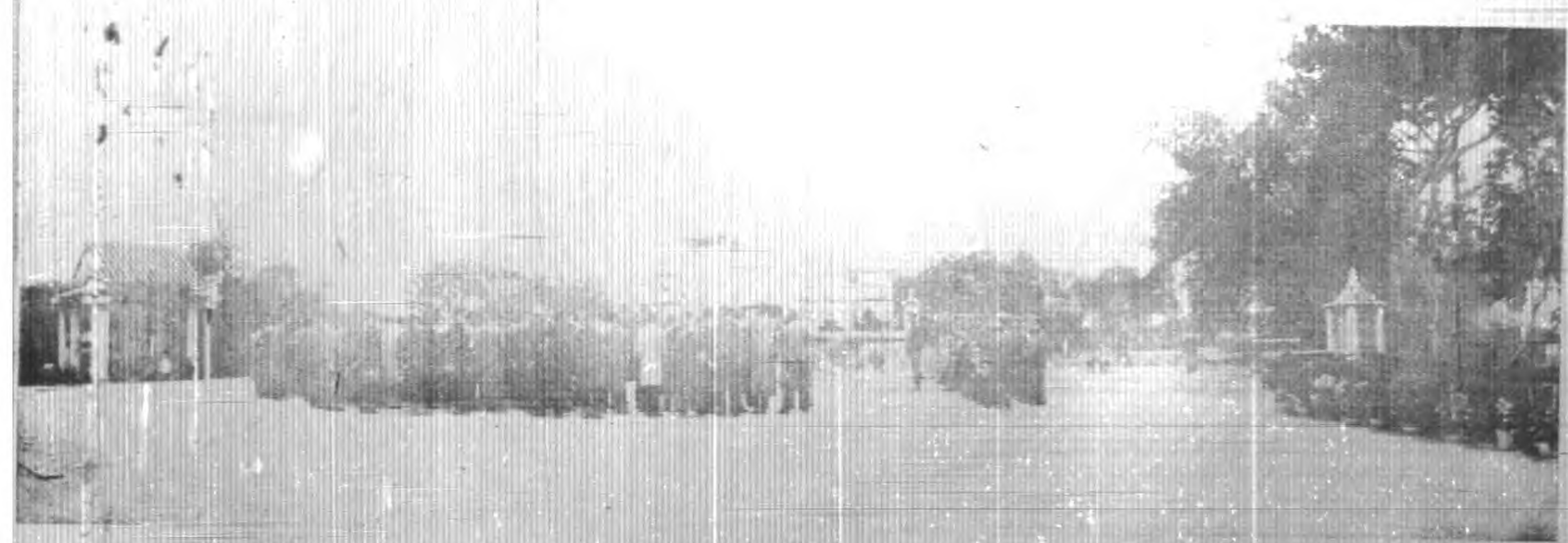
（日七廿月元年八十）形情士烈二十七祭公會大表代省全次三第東廣黨民國國中