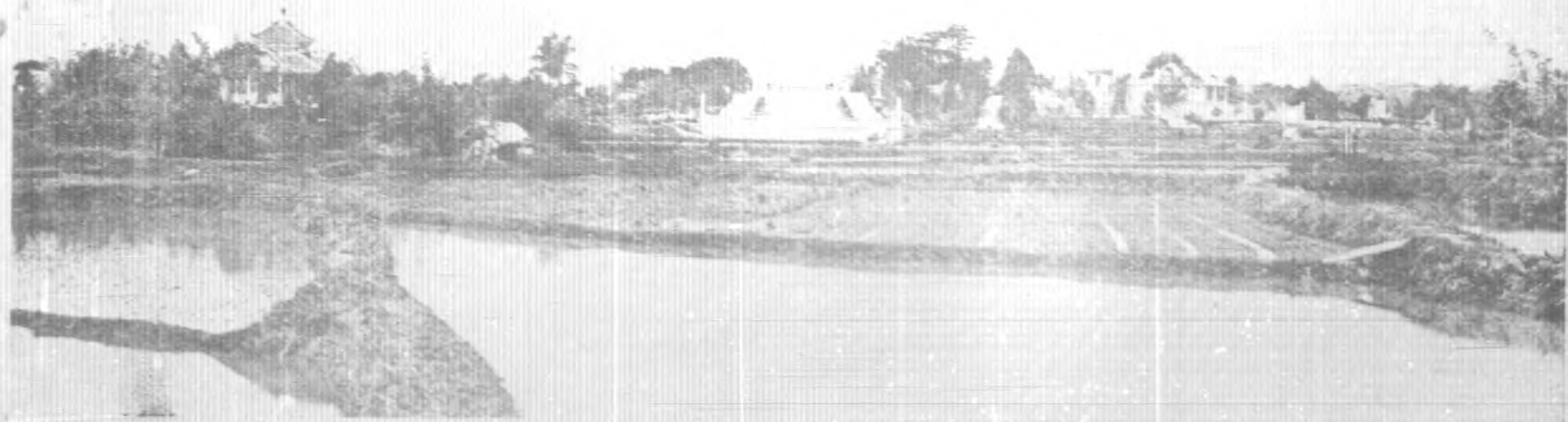
黃花崗七十二烈士墓全景