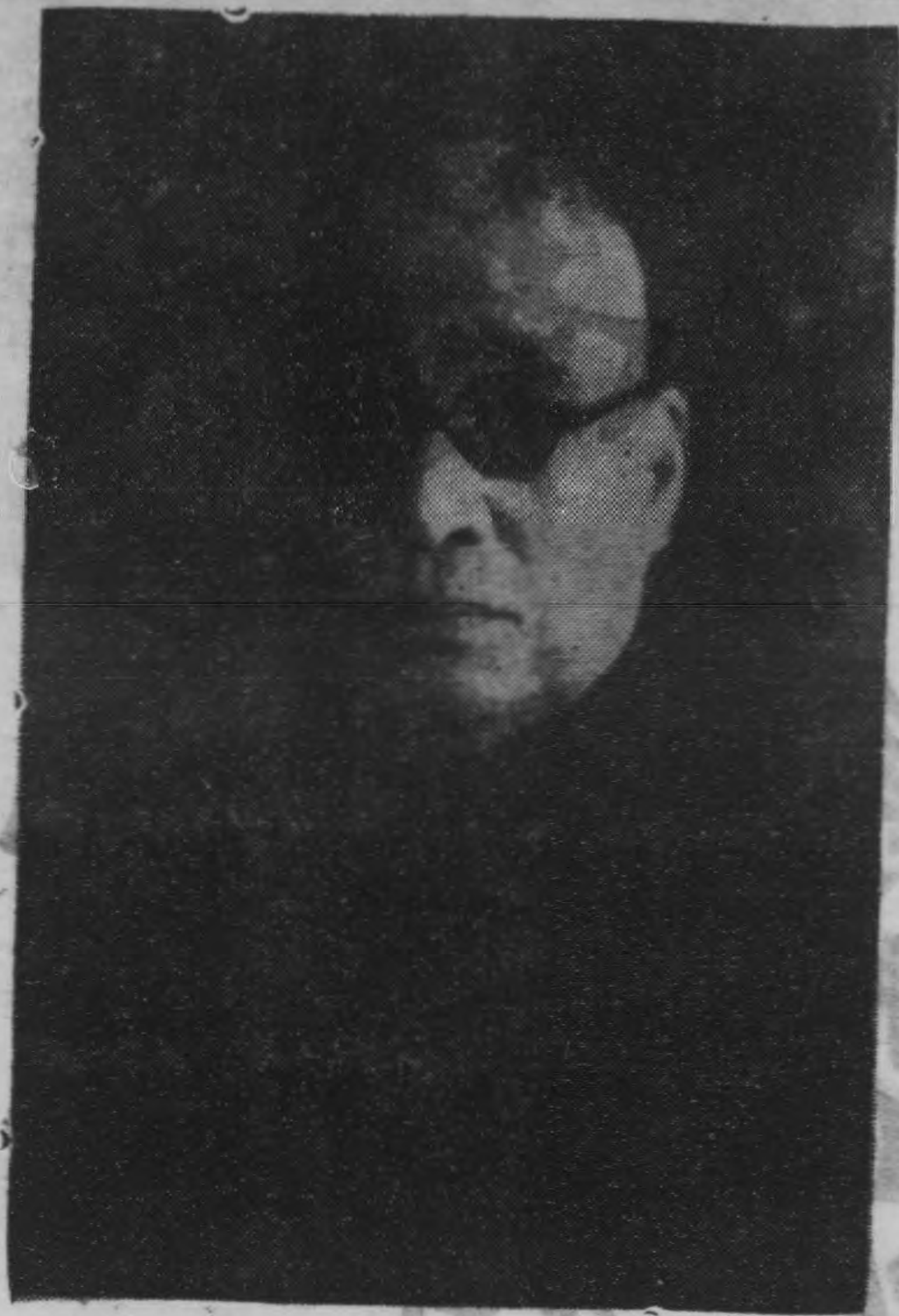
伯 苓 先 生 近 照