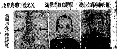
比照肺下鏡光X 滿豐之核愈膠服 瘦形之再病肺癆

梁濟時海狗丸 十個男人 九個腎虧 鄙人現年六十三歲精神不讓青春回憶少年結婚過早色慾過度遂成九醜幾至不能人道後經友人介紹服此丸服後精神煥發體力增加至三十歲後開端發育迄今生有男丁十二人女八人皆口齒齊全且公認濟世此丸早已風行不絕今特將此丸介紹於世凡患此症者請即購服此丸 命海狗丸為國家產藥為同羣謀幸福非只敢傳傳而各界週知有同試焉 梁濟時藥行啓