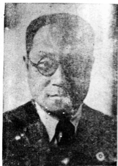
生先學啟傳員委任主會備籌兼長會副