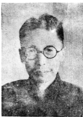
生先璣少平長會副