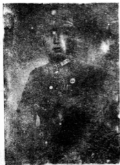
生先煥文葆長會副