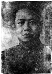
生先五輯何長會副