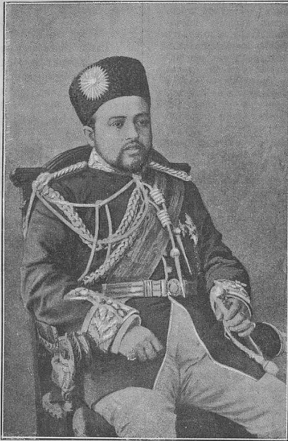
Хабибулла-ханъ. Новый эмиръ Афганистана.

Для этого по окончаніи cadaго лагернаго сбора назначается коммиссія, которая свидѣтельствуетъ лагерь и составляетъ актъ съ показаніемъ въ немъ: а) въ какомъ составѣ