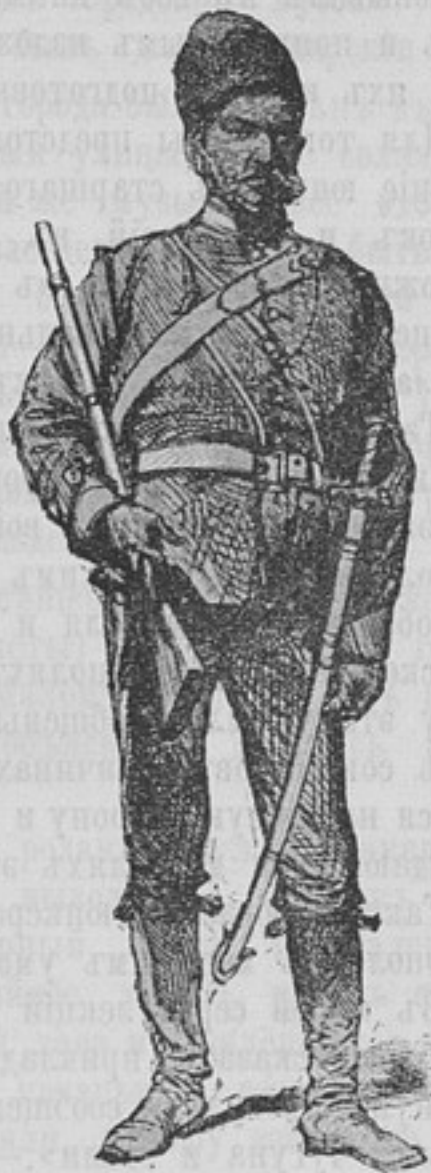
Навалеристъ афганской арміи.

Все изложенное приводитъ къ заключенію о нессостоятельности устарѣлой системы довольствія и отчетности по пала-