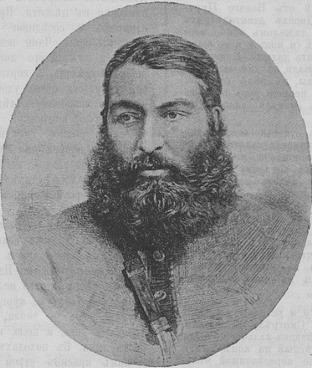
Абдурахманъ-ханъ, эмиръ Афганистана † 3 октября 1901 г.