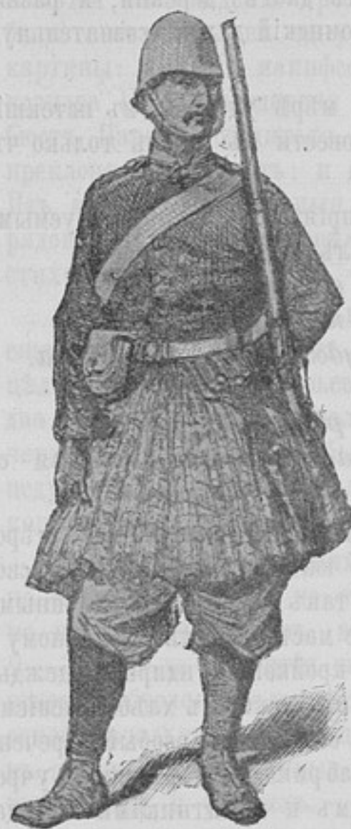
Горный стражникъ афганск. арміи.

Теперь, когда всѣ юнкерскія училища переходятъ уже къ новому строю, къ новымъ порядкамъ (вслѣдствіе совершившейся реформы), приближающимъ ихъ къ типу военныхъ училищъ, не безынтересно, казалось бы намъ, взглянуть на внутреннюю работу послѣднихъ 2—3-хъ лѣтъ, приложенную въ одномъ изъ юнкерскихъ училищъ для пополненія пробѣловъ въ воспитаніи и общемъ развитіи юнкеровъ, и на достигнутые въ этомъ отношеніи результаты.