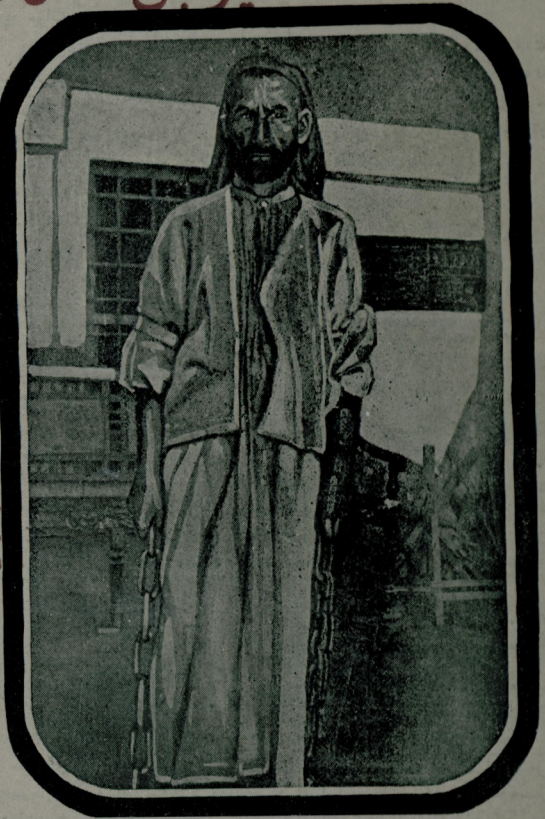
السلطان السان آي ييفرمله خناختي لركتاب ايدن بر انسان

لو صبه مزده فات تجيع بر حقيقت اوكره. نه كيكيز: شمديدن سوبله لم كه بلا مبالنه، توبلر كيز اور برهك. موصله بر قاتل، زوجه سيبه برابر ۳۷ دانه چوجوني كهرك بوتازه انسان آتندن قاوورمه يايتمش و اهالي به صامتشد.