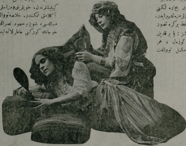
اك صوك موده كوزل صاجلر