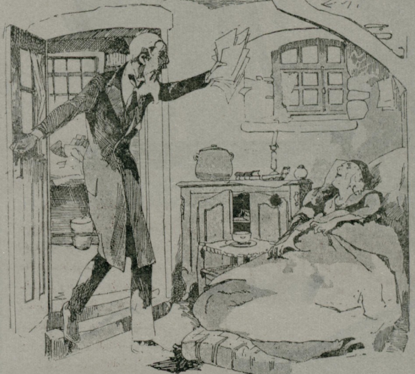
بورغونه بر فرياد سسيه باغبردي : شارلوت

يارمزي نه يايچمزي بيلميه چكز . اللههكي كاغدي خيزله صالايهرق دوام ايدي . — حسابلري باشدن آشاشي تدقيق ايتدم . آكلابورميسك ؟ رادايوم اولديني محقق ، اونكي اختراعده بولنده . دون قور شوندن بر كوله اوچوردم . آكلابورميسك ؟ بالون كي كئندي . ششيدني باق . بر آي آني يايق ايجون آني كون كيدوب كله مدتي . تمام ، بر كيلو رادبومه عودت ايتمش بوله من . غراي اوج بيك آتون اكيوسه ، الك آشاشي حسابله بو زميلون فرائق ياريسي سنك اقربا لريك آيرايچمز . بزه قاله جق ، اللي ميليون . چيغئل كده كيري آليز ، شاونيه كيري آليز . سنده مطلقا