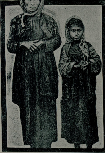
كشمه و بهاسي طرفندن كسندن چوجوملك مديسه پوزه قيز و اناسي قازي