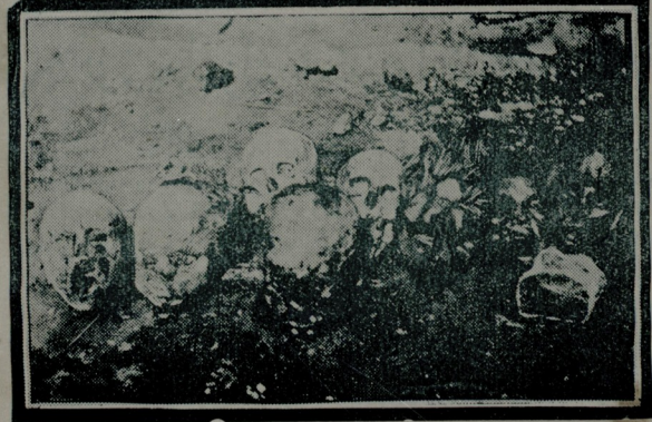
كسيوب قاوورمه ياشانان قاوورمك قورودن چيدان قناقچلرني