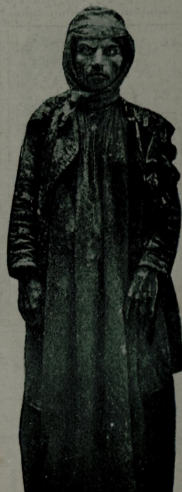
قاوورمه شرف ورتيله كاتيب قبول ايجنه خيمه روك دى قاهلعي

يام ياملر عاقد منقبول زى هر زمان همچانه كثيرره بر انسانك كندى جنسندن بر مخلوق به منسته يك كوچ عقل ايدر بررز. دوشو نوزك آرازنده ياشانان كد بلرله كو بكي بيله نرم آتلمى به مزل. آفر قناك جمبول طوبرالرنده اسيرلرني بشروب معده به ايندرن وحشيلرى قصور اتمكنن بيه فورقارز. دوغروسي سوبله مك لازم كلبسه بوبله مجاش شيرك اولديفته يكد ايناتقني ايسته ميوز. فقط نه چاره. بشريته بونوع جاناوارلك خاطر و خياله كله بهك قدر مدمش طرقلر وارا قارلرني به و شقاريله برابر تقدير ايديبور. يازار رده نوبلرني ز اور بر ريبور. بووك حربك اورتالرينه دوغرو سوربه ده اولديكي موصال حواليسنده به بر آجاق اورتالي قاصوب قاووريبوردى. اهلي آج ادى.