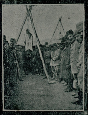
اوتوزايي قاوورمك جانه ابدادن مسركا سيبه جان درن يام ياسلر قيرلى كوجوك اولدي ايجون اولومدن فور تولندي. انسان جناتك ده شقه باقرق دار آخاجني آز كوريبور. بو بله نه قانوي اولوم دكل، كرچك، اشكنجه بيله لطفدر.