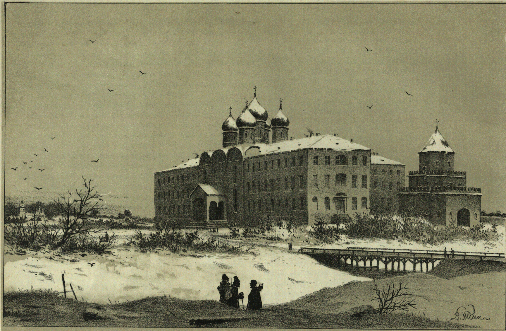
Измайловская Военная Богдѣльня, близъ Москвы.