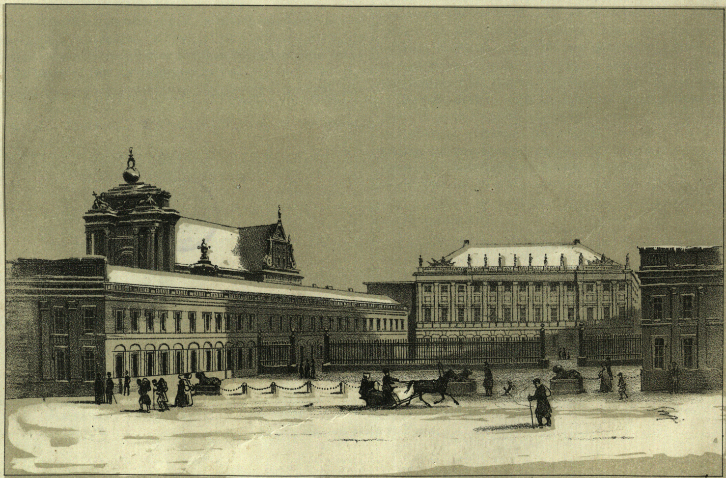
Дворецъ Намѣстника (palas Namiestnika), на Краковскомъ Предмѣстьи, № 387, въ Варшавѣ, сгорѣвшій 22 го февраля (5 Марта) 1852 г.