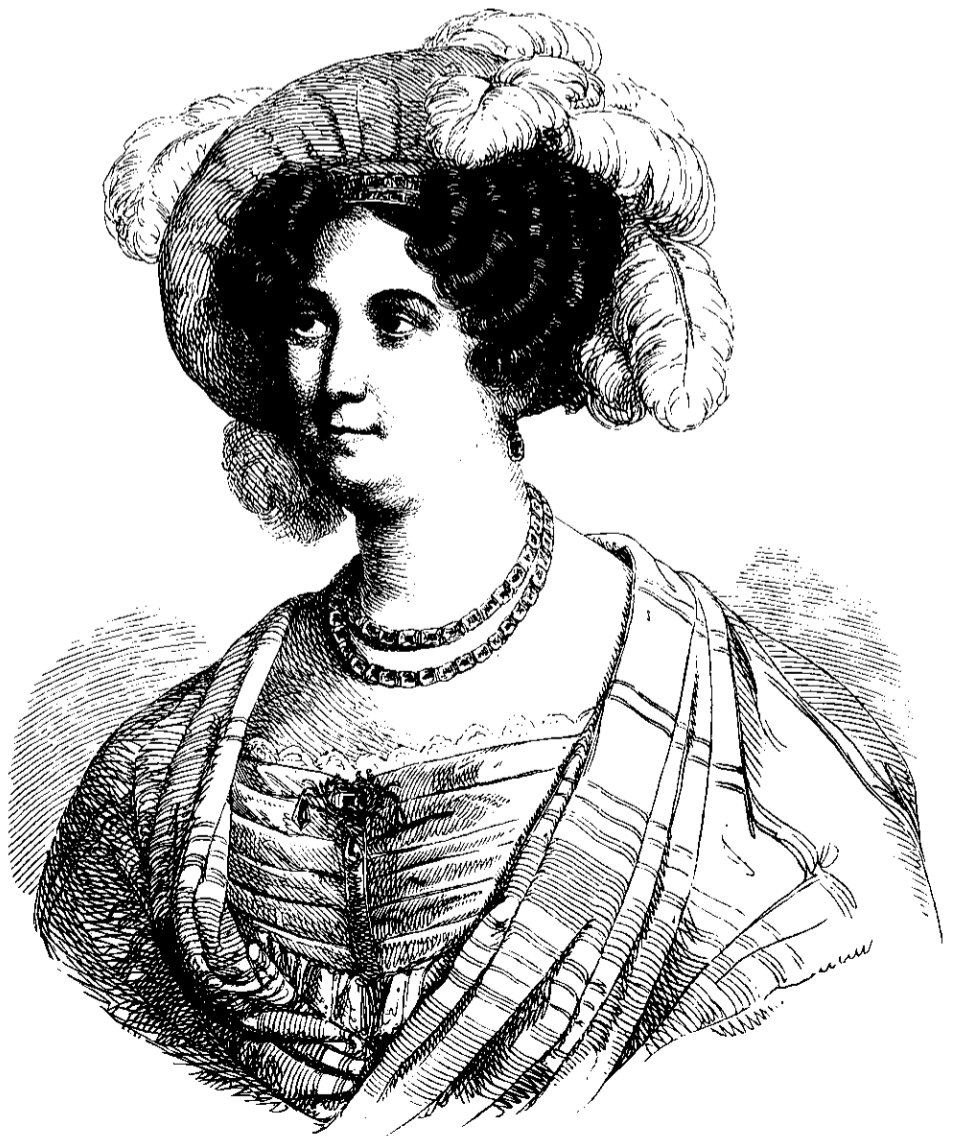
Eugenia Bernhardina Desideria. (Efter et Lithographi.)

Aar 1829 blev Dronning Desideria i Stockholm høitidelig kronet til Sverigs Dronning. Hun havde længe udtrykkelig og lidensabeligt ønsket denne Udmærkelse; det var en lille Fruentimmernytte af den forhenværende Mademoiselle Clary, og man tilgav hende den gjerne, fordi hun forlængst havde forstaaet at gjøre sig afholdt og fordi man hos hende anerkjendte mange Døder, der nok kunde opveie en lille koimdelig Svagheit. Hendes Gemal var maaskee den Eneste, der ikke kunde skjule, at han fandt denne Ceremoni „aldeles overflødig“ for Dronningens Vedkommende, og denne hans Stemning forbedredes ingenlunde ved den Omstændighed, at Kroningedagen tilfældigt udmærkede sig ved det mest ugunstige