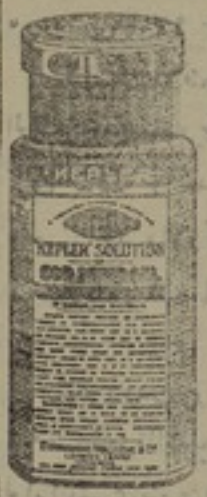
شكله مصغر جداً

محلول ، كيدلار ، هو اعظام طعام مقو يساعد المسن وله مفعول كبير في تركيب الجسم محلول ، كيدلار ، يتحول بسرعة غريبة الى دم وعضلات ومادة لحمية ودهنية وعظمية ونخية محلول ، كيدلار ، يشفى من امراض السهل اذا اخذ في حبه واذا تناوله الشبان المصابون بامراض الظهر