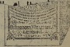
شكله مصغر جداً

راغبين واقدمهم وادبع في ول ينضرون جوعاً ويقضون هلعاً لو اخذتهم هول . وقد سرنا مكاشفة نوابس اللوزارة بهذا الخصوص ادنها بما تؤول اليه الحال من جراء استخدام المعين المسلمين وغير المسلمين وبتماقرين نتيجة هذه