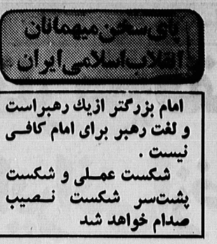
ایران پیشرو ملت هاد راه بزرگی و عزت است

● من خدا را شکر می کنم که یکبار دیگر اجازه داد تا این ملت و این ملت را ببینم. ملت ایران یکبارچه شده است و دیگر بصورت برهمنی برانگشته نیست. من برای ملت فرانسوی می باشد. در پارس بیش از ۴۰۰ هزار دختر مسلمان هستند که می تواند به درسها برود، زیرا سرشود آنها در دست جبار سنگینان منطقه است که پول خود را به صهیونیستها میدهند و در زمینه های مختلف مثل هنرهای و زمینه های که علیه اسلام است، سرمایه گذاری می کنند، اما مقدمات تحصیل این همه را فراهم نمی کنند، من چون مشغول خدمت به مسلمان هستم، فراموش می دهم که رهبران عرب حتی یک شل در اروپا برای یک رب فراموش نمی کنند.