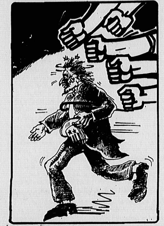
روزانه «الزحلالخضر» ارکان کینههای انقلابی

انقلاب اسلامی ایران ملت جهان را به پشتوانه بی پایانی از تجربه های مبارزاتی و چگونگی رویارونی با امپریالیسم جهانی مجبزه کرده است.