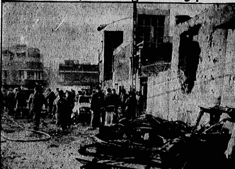
عکسهای اختصاصی اطلاعات از صحنه حادثه

صبح امروز عمال خودروسه آمریکای جایتکار بیکار دیگر چهره کریهت و دردی را بر صورتشان کشیدند. شهادت و مجروحین حادثه انفجار بمب در میدان عشرت آباد جز چند باسدار، راننده‌های محصل مسافر اتوبوس و سایر معمولی‌ها کسی دیگری نبود. البته زن سه‌ساله‌ای که در میدان کتف و وحشیانه‌ای جز صف و زبونی نوکران آمریکا که دیگر به‌سخت‌گام‌های نظامی رسیده‌اند نیز دیگری را نشان نمی‌دهد. در عین حال کیف مدرسه دختر بچه معلوم که در اثر حادثه کشته شده و بر زمین ریخته و با درس و مشقش هم آشفته دیده می‌شود. و عکس باین نیز صحنه‌های حادثه دلخراش امروز و اتوبوسها و ساختمانهای آسیب دیده را نشان می‌دهد.