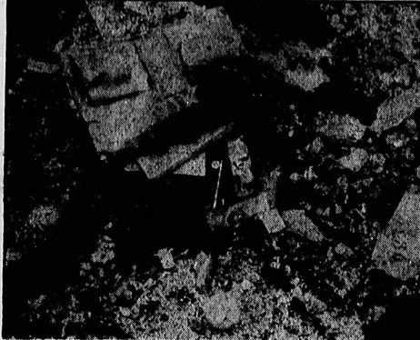
عکسهای اختصاصی اطلاعات از صحنه حادثه

کیف دختر بچه‌ای که در راه رفتن به مدرسه بدست عمال آمریکا شمشید شد