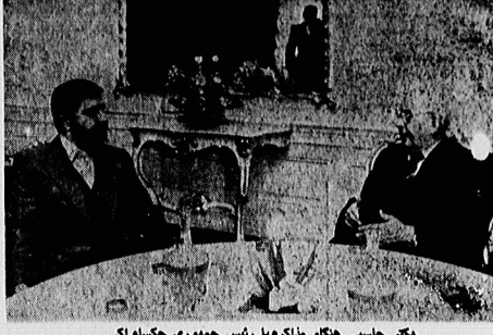
مگر جنسی هنگام ملازده با رئیس جمهوری جکسلاواکی

مگر جنسی مائوینکس در این دیدار با کشور رومانی، ملاقات با خیالکی چایسکو، رئیس جمهوری این کشور و مائوینکس در دیدار با مای رومانی جمهوری و سوسیالیستی جکسلاواکی و پاد آوزیدیم که در این دیدار با مائوینکس ملاقات داشته است.