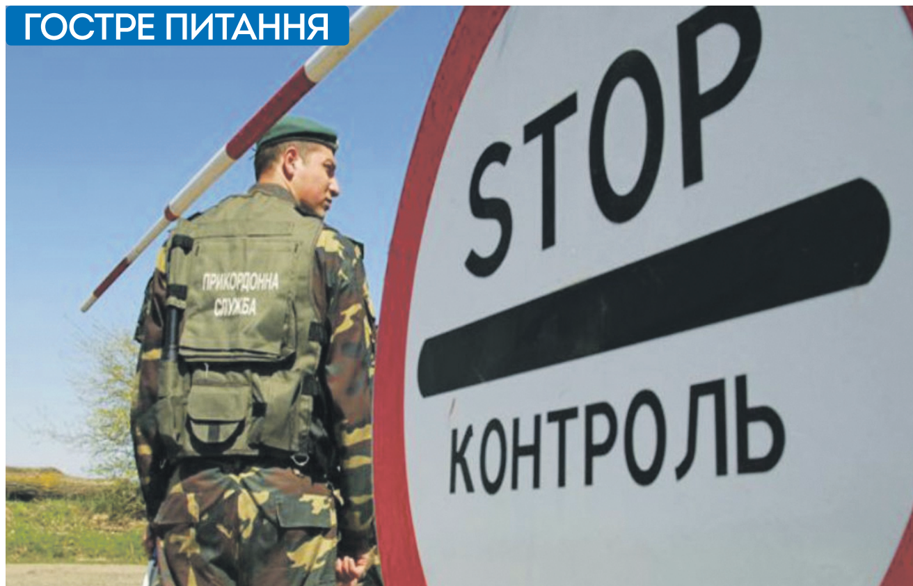
ФОТО З ВІДЕРЛИХ ДЖЕРЕЛ

2. Особисті речі, що провозяться у ручній поклажі або у супроводжуваному багажі (наприклад в особистому транспорті), не підлягають письмовому декларуванню (лише усному). Вага та кількість особистих речей для повсякденного вжитку при перетині адміністративного кордону з Кримом не обмежені законодавством. Такі речі, а також кошти, дозволені для провозення через державний кордон без письмового декларування, не можуть бути ані конфісковані, ані тимчасово вилучені, – оскільки конфіскація та тимчасове вилучення товарів під час проходження митного контролю можливі, лише якщо ці товари стали безпосереднім предметом порушення митних правил або можуть бути необхідні як докази у справі про порушення митних правил.