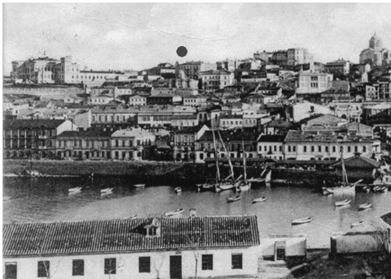
Листівка XIX ст.: Артилерійська затока Севастополя, у панорамі – Головна хоральна синагога (під синьою цяточкою)

Євреї робили великий внесок в економічний розвиток міста: на власні кошти вони збудували лікарню на березі Південної бухти, відкрили громадські чайні, у своїх майстернях шили модний одяг для заможних, обшивали міський люд.