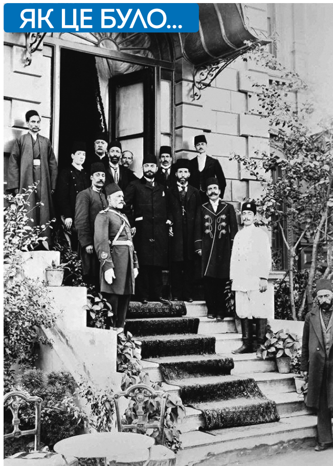
Кримські татари в Туреччині

Спочатку деякі місцеві чиновники намагалися запобігти зростанню еміграції, але невдовзі були зупинені розпорядженнями уряду. Так, у 1902 р. губернатор Таврійської губернії В. Трепов писав: «Вважаючи неможливим і навіть марним утримувати насильно татар у підданстві російському й у межах імперії, я в той же час визнавав би дуже бажаним придбання залишених ними земель у руки росіян. Для кращого здійснення цього було б конче бажаним, щоб Кримський банк оповістив через державне посередництво місцеве татарське населення про бажання своє купувати землі і при цьому оголосив свою ціну. Я переконаний, що цим буде зроблений дій-