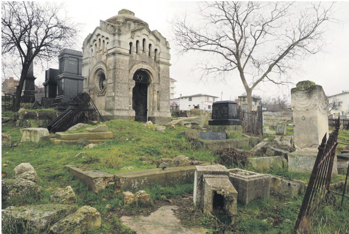
Єврейський цвинтар Севастополя

Долею євреїв Росії займався створений 28 жовтня 1860 року державний комітет. У 1861 році він дійшов висновку: «Сама історія законодавства вчить нас, що є лише один вихід, один шлях, щоправда, повільний і поступовий – визвольний шлях, що об'єднуватиме євреїв з усім населенням під захистом одних і тих же законів. Про все це свідчить не теорія або доктрина, а жива багаторічна практика».