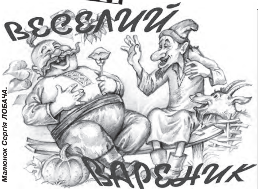
Малюнок Сергія ЛОБАЧА.