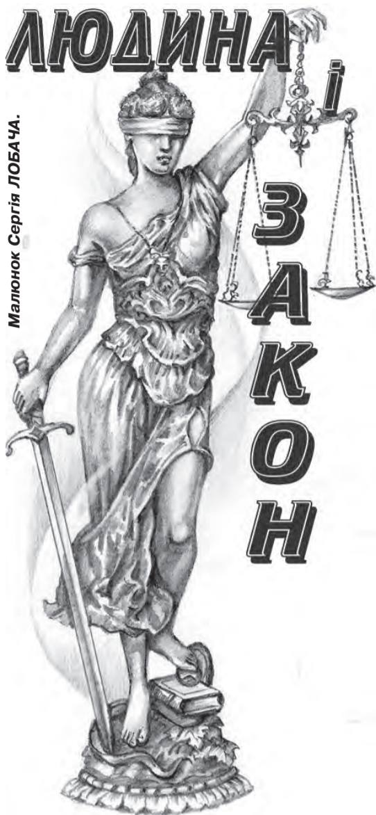
Малюнок Сергія ЛОБАЧА.