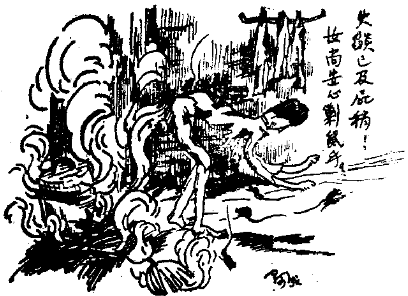
大談已及此稿！ 世尚生心對鼠身