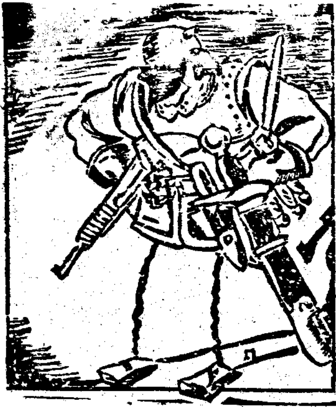
日寇侵略我國的經濟基礎

擴大軍備，平常軍費的支出，已佔全國政費十分之七，已經擴張到極限。侵佔我們東四省起兵華北，每年又增加他人民負擔十五萬萬的日金。二年來，冒險的對我國加緊侵略，使他不得不增發公債，達九十萬萬元之多，合其他公債來算，他們國內人民每個人已得負擔國內外債款五百八十元左右。我們在開始抗戰時，不是也發一次五萬萬元的救國公債嗎？大家應該還會記得，以來比起他們所發公債，真是有天地之別呢。再講起日本鬼子國家經濟，本來靠國內許多小手工業品買到我國英美以及南洋等地，得些金錢的。現在我國當然是不買日貨了，就是英美南洋各地不是也大喊着抵制日貨嗎，許多碼頭工人不卸日貨，許多社會人士簽字不用日貨，不和日本鬼子交易嗎？同時我們還知道一件事實，是他們國內有許多工廠，都因為工人都被徵召來中國送死，原料也很缺乏，就倒閉了十分之五六。而他們軍閥還是天天喊增加軍費，天天想增發公債，這樣一來，弄