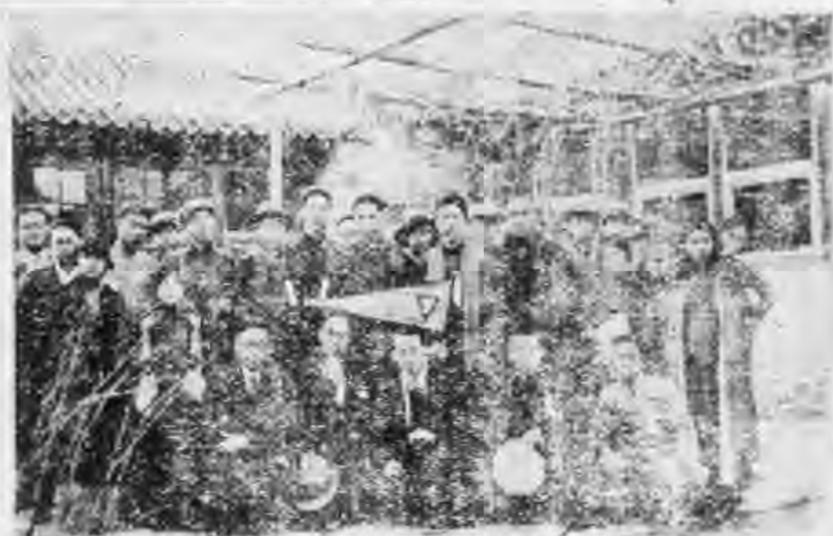
贈攝君侯康張 ◀影留堂學育觀參員會會本▶

員十二人，以本會會員為限，欲參加者，請到本會接洽，毋任歡迎。 ▼成人會員室籌備刷新 本會會員室，為成人會員業餘極良之休憩處所，年來因會務日漸發展，該室頗感不敷應用，刻為擴充會員設備起見，擬將閱書報室移至開事處