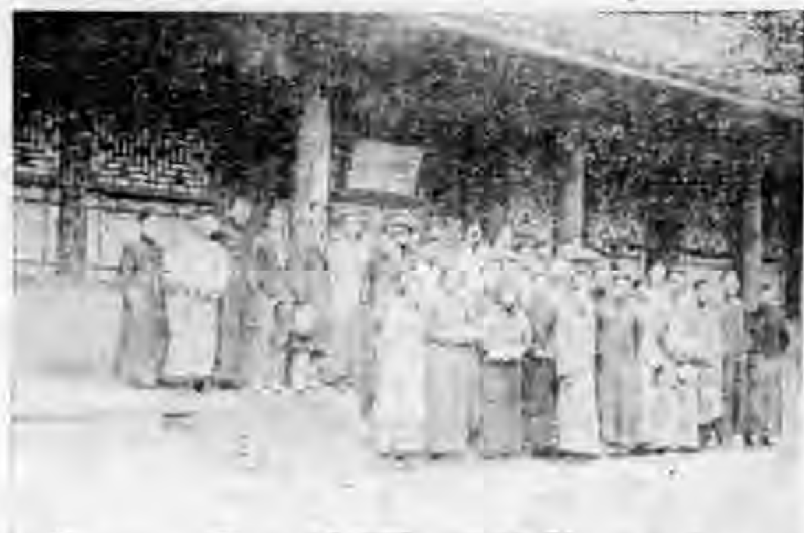
財商學生會參觀戲曲學校留影 ◀ 五君贈

組織教學研究會——該校因本年學生數目驟增，為增進教員教學效率起見，經校務會議決組織教學研究