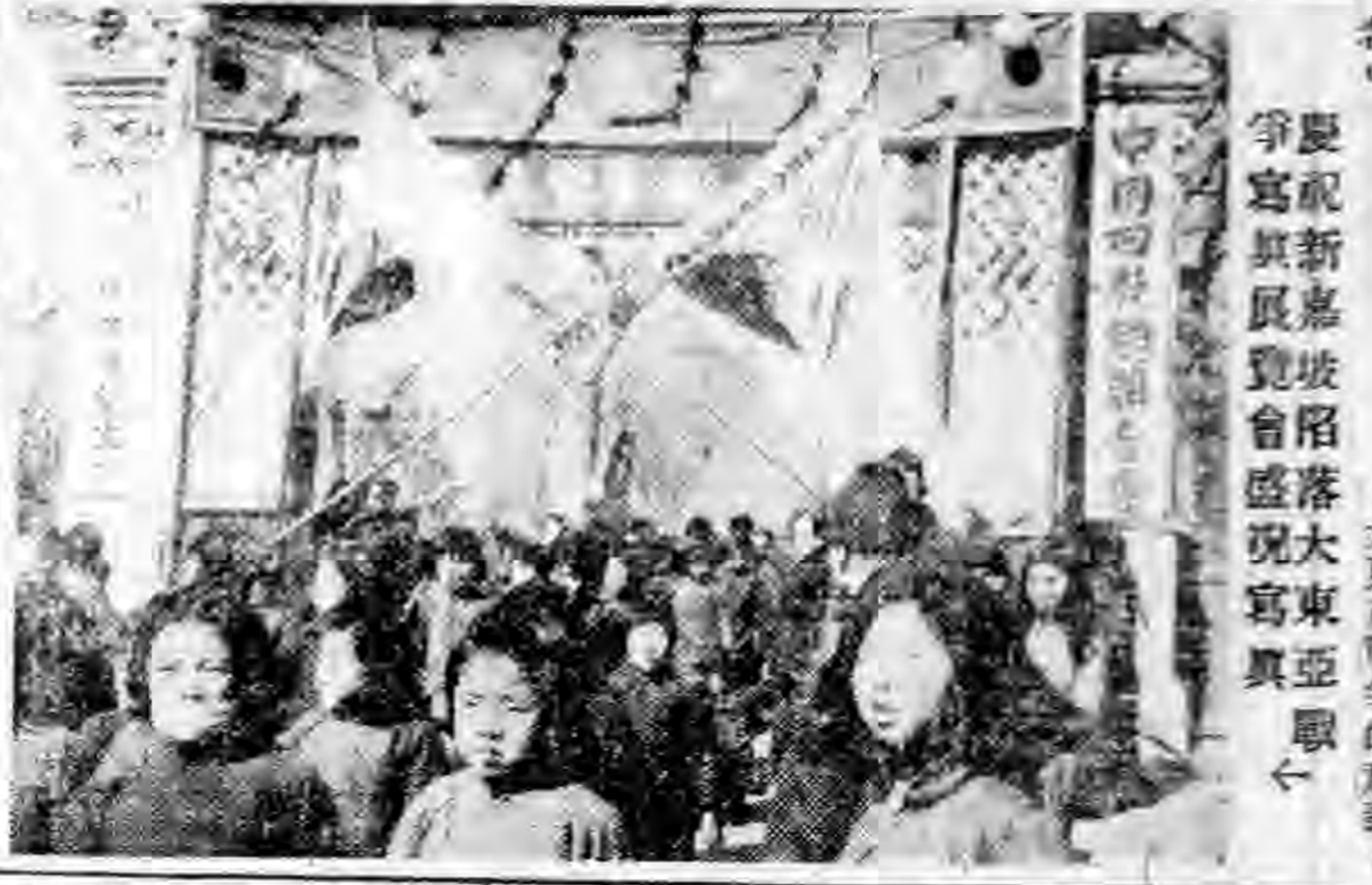
慶祝新嘉坡陷落大東亞戰爭 寫真展覽會盛況寫真

大東亞戰爭 亦隨戰事的進展而增長。開始以來，世界情勢發生了絕大的變化，同時東亞民族的地位，亦隨戰事的進展而增長。