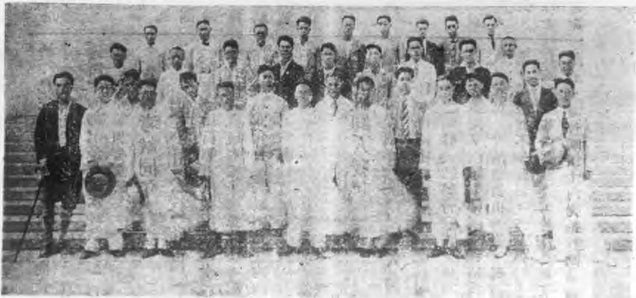
本社第一屆暑期學校全體體謁陵攝影