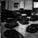
← 結古茶葉之堆積（用牛皮包備運藏）