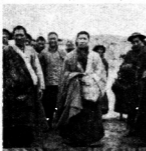
→ 結古與漢人結婚之藏女