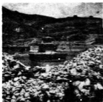
→ 結古寺山下之風景