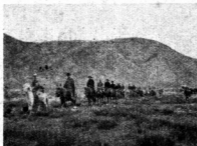
二乘馬者爲趙專使友 琴第三爲著者