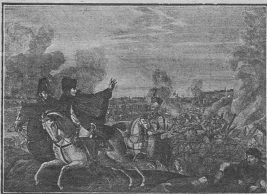
Бѣгство Наполеона изъ Россіи. (По современной народной гравюрѣ).

До Вильны дошло не болѣе четырехъ съ половиною тысячъ французовъ. Русскіе упорно преслѣдовали бѣглецовъ. Боковые непріят-