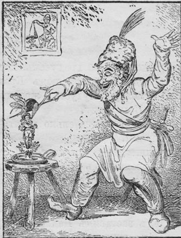
Казакъ, гасящій Наполеона. (Карриатура Тербенева).

Вскорѣ послѣ казаковъ, у Смоленска показалась и русская армія. Наполеонъ торопливо выступилъ по направленію къ Красному.