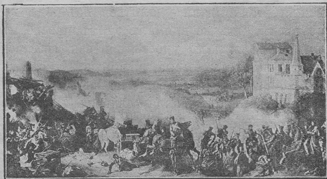
Сраженіе подъ Малоярославцемъ.

Проговоривъ это быстро и безъ перерыва, Наполеонъ вдругъ прервалъ рѣчь, схватился