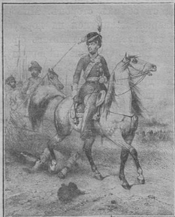
Гр. М. И. Платовъ.

Нашъ фельдмаршалъ рѣшилъ неотступно преслѣдовать Наполеона, котораго въ тылу донимали донскіе казаки съ атаманомъ Платовымъ, а сбоку—корпусъ Милорадовича. Ата-