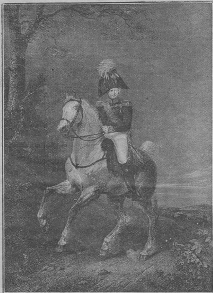
Императоръ Александръ I.