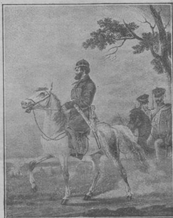
Д. В. Давыдовъ.

Слова Кутузова, что отступленія больше не будетъ, очень подняли духъ арміи. Солдаты готовы были ринуться на «француза» и раздавить его.