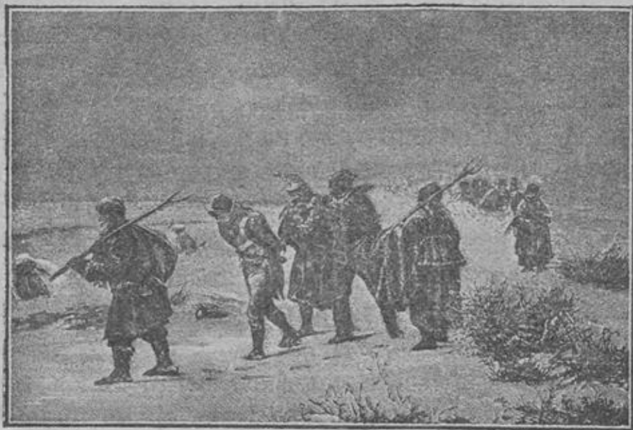
Мужики и бабы сопровождаютъ плѣнныхъ французовъ.

Плѣнныхъ было такъ много, что на нихъ не обращали уже вниманія. Ихъ или забирала задніе полки, или отдавали крестьянамъ гуртомъ для дальнѣйшаго препровожденія внутри Россіи. Плѣнныхъ даже не охраняли, не стерегли.