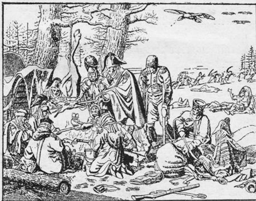
Французы близъ Березины.

Наполеонъ исчезъ съ поля битвы подѣ Краснымъ и, оставивъ на произволь судьбы остальное войско, самъ поспѣшилъ на большую дорогу къ Вильнѣ, въ сопровожденіи кавалеріи (на которой лежала забота прикры-