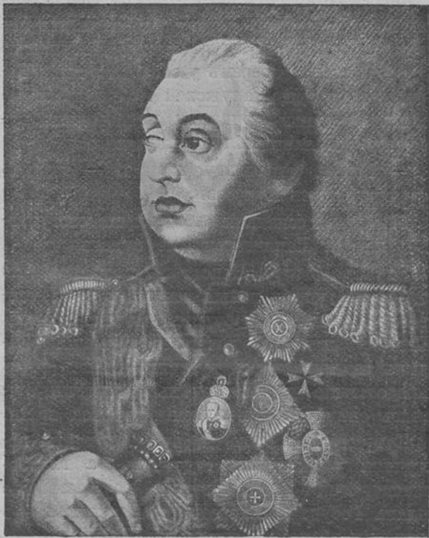
Генералъ-фельдмаршалъ князь М. И. Голенищевъ-Кутузовъ.