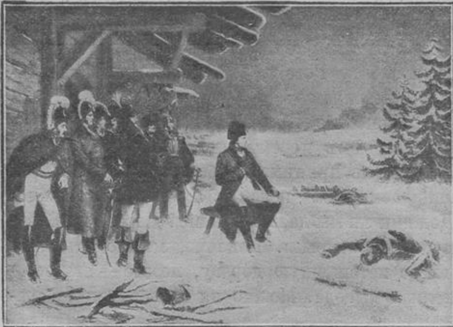
Наполеонъ смотритъ на бой у Малоярославца.

вокругъ него свистѣли пули. Престарѣлаго вождя упрашивали удалиться изъ-подъ выстрѣловъ. Онъ не внималъ этимъ просьбамъ, такъ какъ желалъ удостовѣриться, собственными глазами, въ намѣреніяхъ Наполеона.