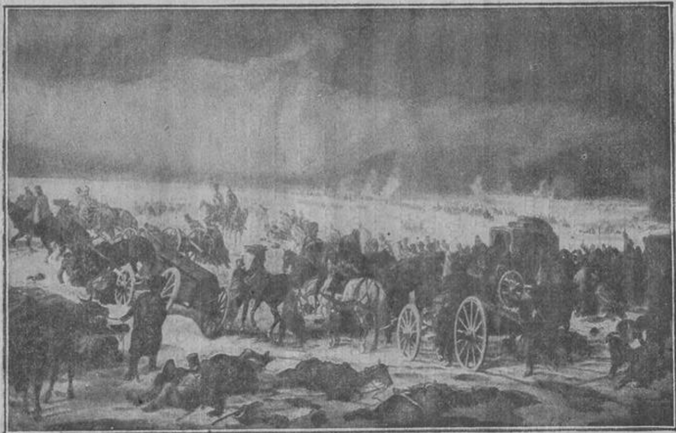
Отступление французской армии.