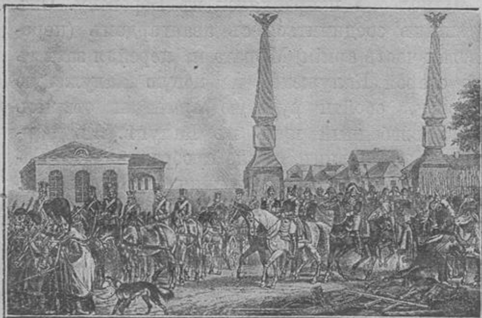
Выступление французовъ изъ Москвы.

Наполеонъ вышелъ изъ кремлевскаго дворца задумчивый и, молча, двинулся въ путь. Все еще большая армія его направилась на