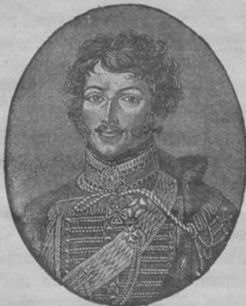
А. Н. Сеславинъ.

Узнавъ объ этомъ, Кутузовъ немедленно отрядилъ туда корпусъ генерала Дохтурова и рѣшился велѣдъ самъ двинуться съ ар-