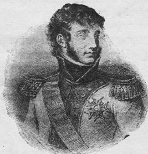
Французскій маршалъ Мюратъ.

Обманувшись въ своихъ надеждахъ на миръ, Наполеонъ, наконецъ, черезъ двѣ недѣли спохватился и послалъ своего зятя Мюрата съ пятьюдесятьютысячнымъ отрядомъ преслѣдовать Кутузова. За отрядомъ слѣдовалъ цѣлый обозъ награбленныхъ вещей: золотыя и серебряныя издѣлія, мѣха, сласти,