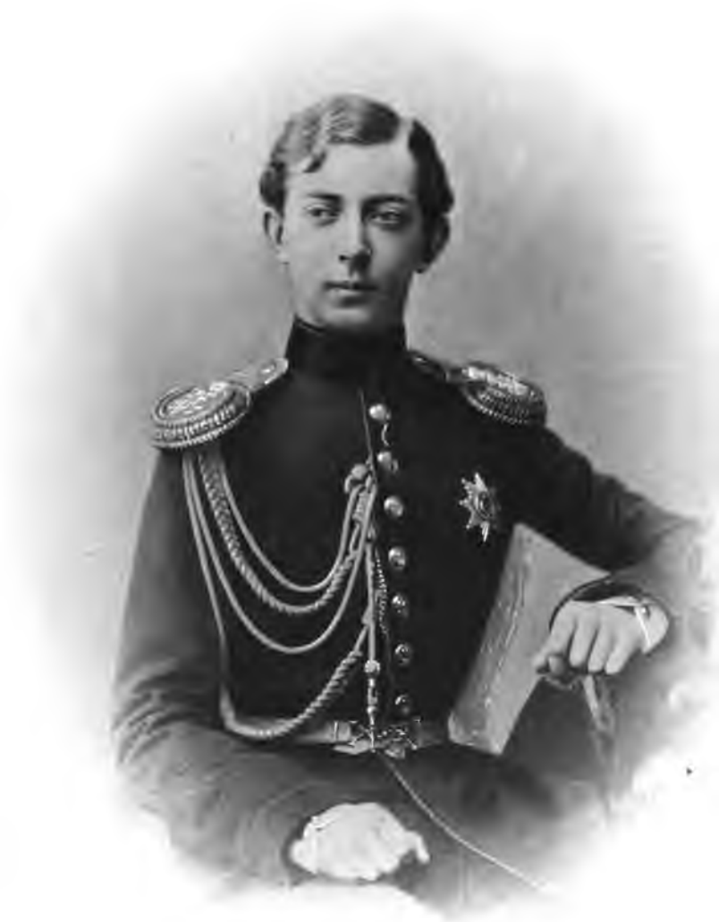
Цесаревичъ Николай Александровичъ