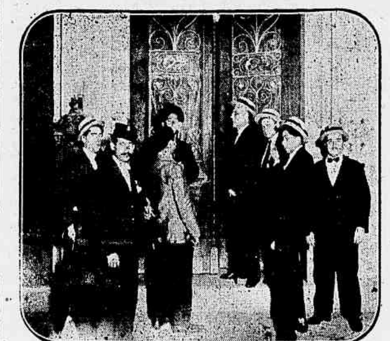
O delegado do 12º districto abria a porta da sede propria do Centro Cosmopolita para o atrelado a directoria.

As 13 horas de hontem, foram recebidos, no Palacio do Catete, pelo presidente da Republica, os representantes das diversas associações marítimas de culto entelhamento anterior, com o governo, resultou a terminação da greve nesta capital.