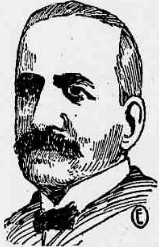
Coronel Dalmace Moner Talmos, novo ministro plenipotenciário do Perú

Os despachos de Lima noticiaram ter sido nomeado ministro plenipotenciário do Perú junto ao governo do Brasil o sr. Dalmace Moner Talmos, que foi considerado "persona-