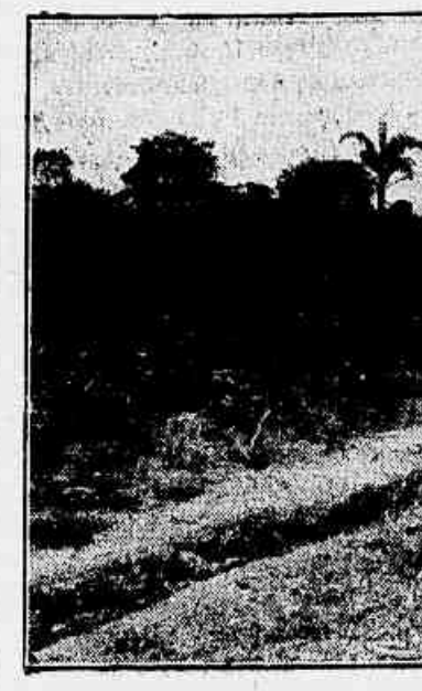
Sítio do sr. marechal Thomatur go de Azevedo, em Guaratiba

"O JORNAL" vae realizar um sortelo de 1.000 lotes de terrenos, SITUADOS EM GUARATIBA