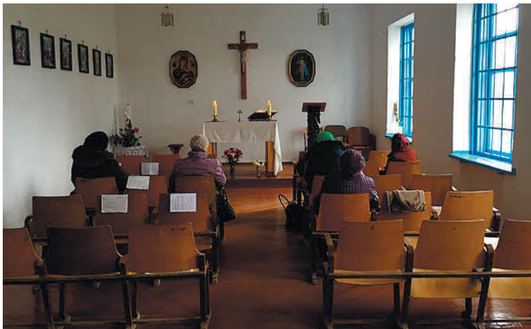
Парафія Матері Божої Неустанної Помочі в селі Лобанове Джанкойського району

парафії РКЦ не можуть бути керовані тамтешнім єпископом, і задля отримання «юридичного статусу» від держави-окупанта їм доведеться перепідпорядкуватися іншим канонічним структурам. При цьому вважалося, що парафії РКЦ в окупованому Криму можуть бути зареєстровані на підставі українських документів, виданих до російської окупації півострова: зокрема, «глава республіки Крим» Сергій Аксьонов під час зустрічі наприкінці грудня 2014 року запевняв у цьому єпископа Яцека Пиля, який мав отримати посвідку на проживання в окупованому Криму. Втім, у Москві вирішили інакше.