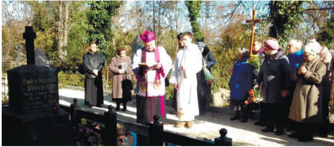
Освячення меморіалу в пам'ять про католицьких священників, що служили в Сімферополі з 1812 року, на Старому кладовищі.