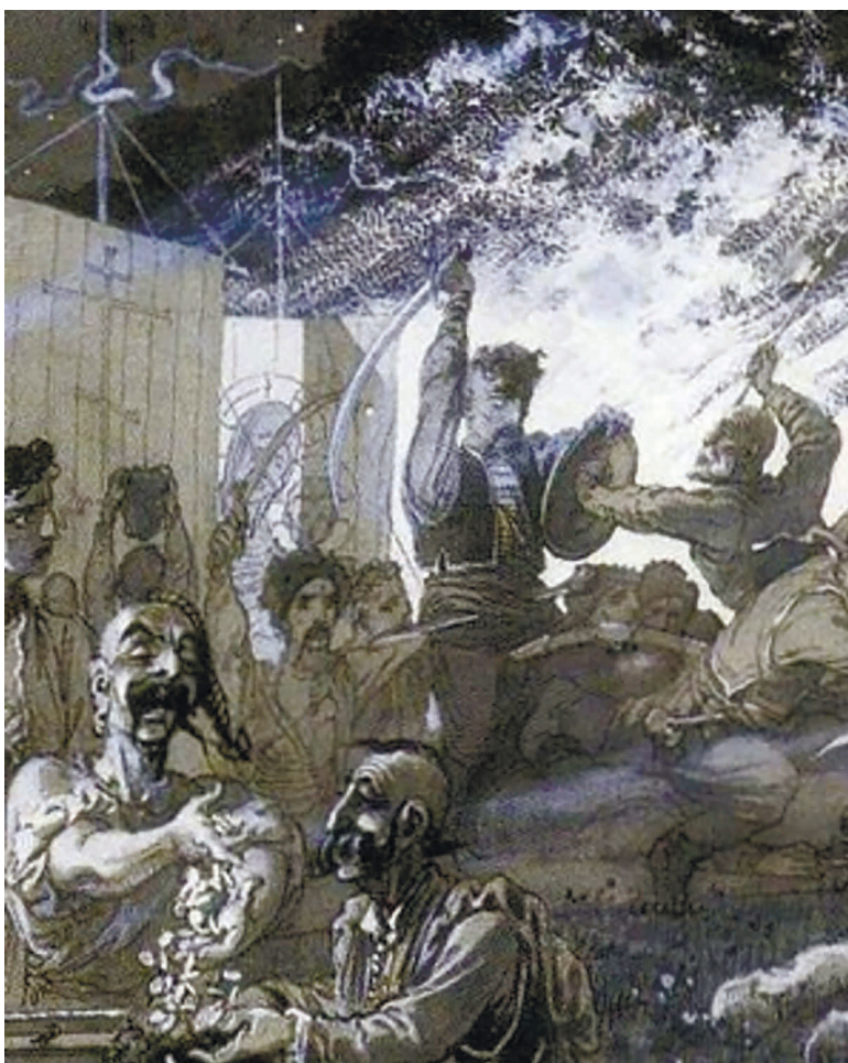
Оліфер Голуб і козацькі чайки

так уже перебував у руках козацтва. Далі Голуб пропонує ліквідувати королівську адміністра-