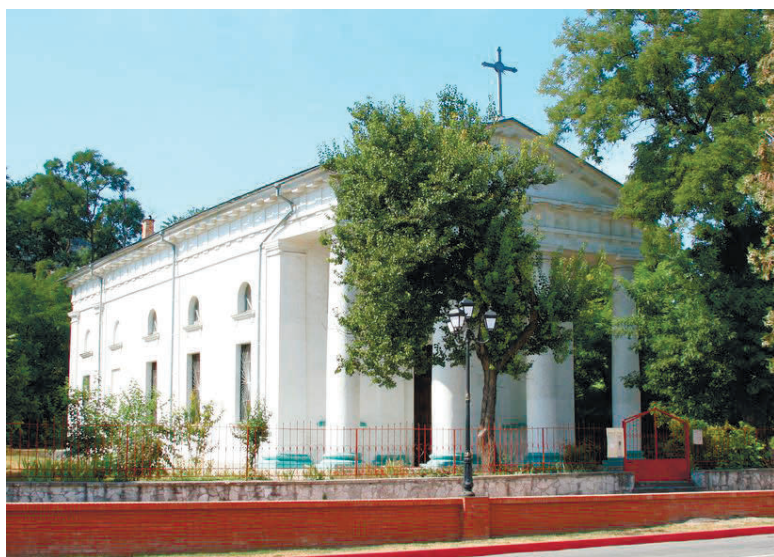
Храм Успення Пресвятої Діви Марії РКЦ в Керчі

повів, що у червні всі 9 парафій в окупованому Криму були «перереєстровані» за законодавством держави-окупанта, після чого один зі священників мав вирушити до Москви для реєстрації пастирського округу. В цих справах допомагали вже згаданий російський архієпископ РКЦ Паоло Пецці та тогочасний Апостольський нунцій у РФ Іван Юркович, який був Апостольським нунцієм в Україні у 2004-2011 рр. Також владика Яцек висловив занепокоєння становищем щодо заборони на в'їзд іноземних громадян до окупованого Криму, прийнятої 4 червня 2015 року: на таку проблему наразився він сам. Лише 16 вересня Кабінет Міністрів України постановою № 722 передбачив можливість в'їзду до Криму іноземних священників для здійснення релігійної діяльності, але з суттєвим зауваженням: в'їзд на тимчасово окуповану територію України та виїзд з неї можливий лише через контрольні пункти на материковій Україні за паспортним документом та спеціальним дозволом, виданим територіальним органом Державної міграційної служби України.