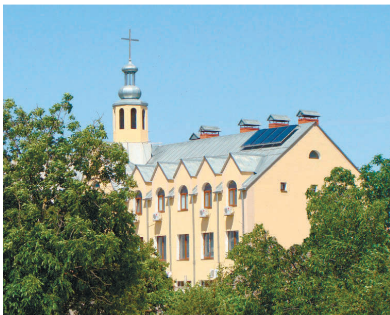
Храм святого Мартіна РКЦ у Євпаторії

Наприкінці липня 2015 року єпископ Яцек Пиль, все ще позиціонує себе як єпископ-помічник Одесько-Сімферопольської дієцезії РКЦ, роз-