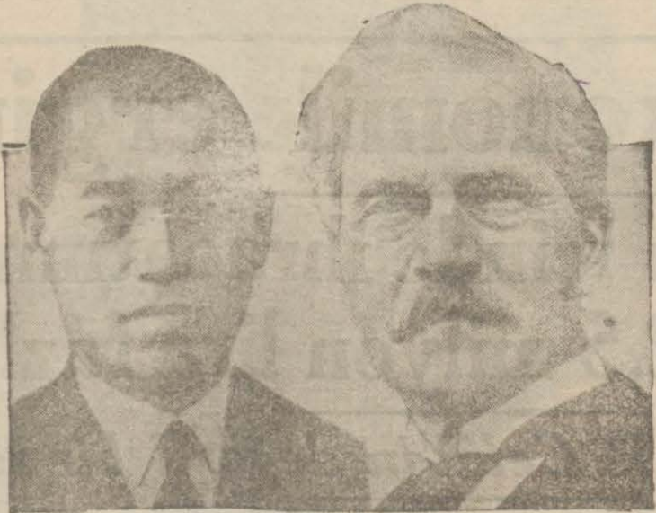
Japon Başmurahtası M. Yamamoto ve İngiliz Başvekili M. Mac Donald

Mekteplerde yazı müsabakalarına devam edilmektedir. Bu müsabakala- ra