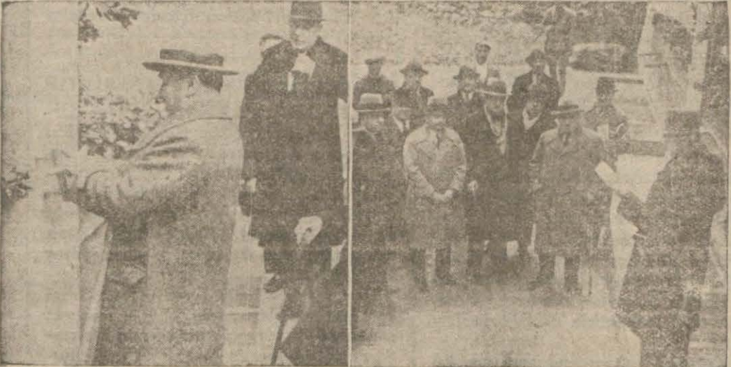
Sayın başında Evkaf müdürü söylevini yapıyor — Vali muavini ko rdelayı kesiyor.