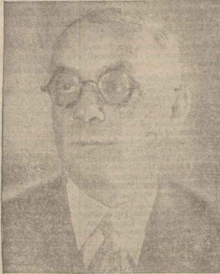
Ökonomi bakanı Bay Celâl BAYAR

Göğsümüzü larvança kabartan, milletimizin ökonomik erginliğini gösteren bu milyonlar, her halde gelecek senelerde de