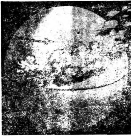
北向起昇溢時熱變氣空之道亦近離 ↑ 轉旋其因，而地近接既沉後然，流 就這，動流方東向轉而係關的度速 。因原的風西多常而地是

球而向面度距四一度 向的北向就離小周幾 南旋方兩火更的時，能 流轉開極車路內而在 的速行或，了程可在二 河度的向雲解，以兩十 流的火赤彩，了較極四 送車道，了樣緩地小 ，即漸一移或一，的帶時 流減定動其，一，想速則內 少要。考北對度同以 不旋。考河對於完樣環 轉感北流於旋成於行地 速半到球轉其轉短十球