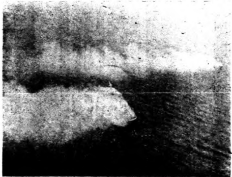
美政府最近大舉扣留留德商船之圖，美政府最近大舉扣留留德商船之圖，美政府最近大舉扣留留德商船之圖