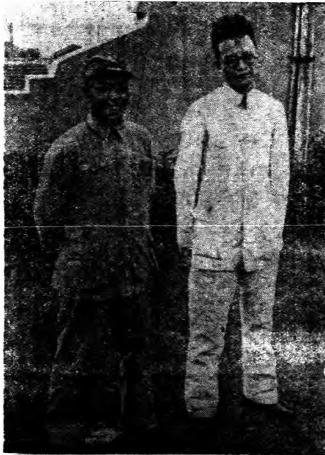
。書秘其為右，英項為者立左中圖 ↓

路，以便截擊堵塞；建築防護堡壘，以削弱共軍攻擊之力；焚燬鄉村中之森林及房舍，使共軍無法匿跡。經此種種壓迫，共產軍內部開始分化，少數部隊發生叛變或投入蔣軍。此時為項英部隊最感恐慌之時期。在外部壓迫與內部分化雙重威脅之下，直至一九三七年蘆溝橋事變發生以後，項英之殘留部隊仍在生死線上繼續掙扎。竄往西北之朱德與毛澤東部隊已和項英失去聯絡，甚至彼此不能互通消息。其後西北共軍派遣聯絡員一名，潛往福建，以蔣軍和西北共軍之西安事件和平解決之經過報告於項英