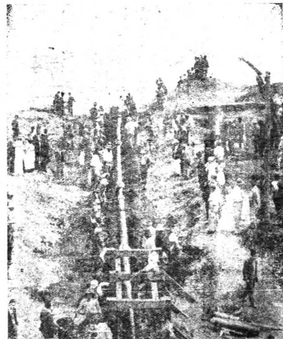
→ 直達敘利亞海岸之伊刺克石油管。

值此戰爭重心由歐洲轉向近東，地中海，以及北非的過渡時期，我們必須把握着兩種主要的觀點：第一，克利特島是英國在歐洲最後的據點。英國不能把守此據點，此後即無進攻歐陸之可能。這與第一次歐戰時的情形迥乎不同。因為英法聯軍於上次歐戰時雖連連敗退，但終未退出歐陸。而這次歐戰發展的結果，竟使英國在歐陸上找不到任何的立足點。所以，自