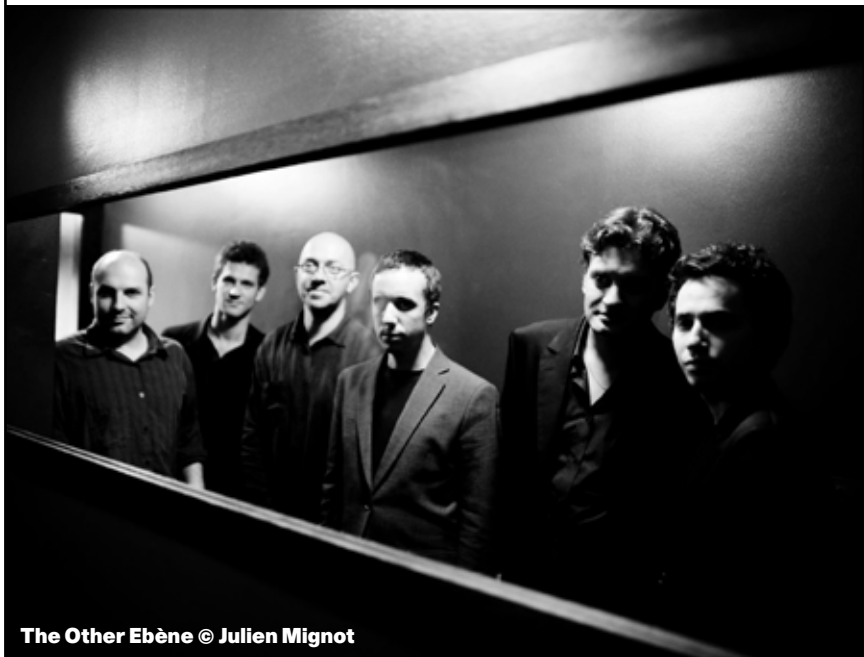
The Other Ébène