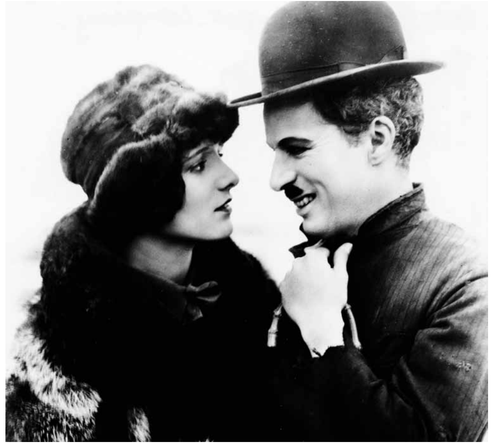
Charlie Chaplin, The Gold Rush

Wat hun beider stijl betreft zijn er dan weer grote overeenkomsten: de humor, de overdrijving, de ironie, het sarcasme, de spot, het cabareteske. Iedereen kent de onsterfelijke typetjes die Chaplin neerzette. Met muzikale middelen heeft Hanns Eisler onsterfelijke portretjes ontworpen voor evenzovele sociale situaties: op straat, in een fabriek, in een kerk, in een kazerne, in een koor, in een gevangenis. Het zijn heldere, scherpe