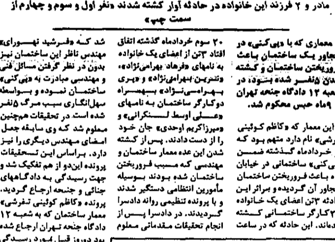
مادر و ۲ فرزند این خانواده در حادثه آوار کشته شدند و نفر اول و سوم و چهارم از سمت چپ.

معماری که با «هی کنی» در مجاور یک ساختمان باعث فروریختن ساختمان و کشته شدن ۵ نفر شده است، در دادگاه جنم تهران به ۹ ماه حبس محکوم شد. این معمار که کاظم کوئینی تفرشی نام دارد متهم بود که در خردادماه گذشته ضمن شدن این عده معمار ساختمان و مهندسی که موجب فروریختن ساختمان شده بودند بوسیله مأمورین انتظامی دستگیر شدند و با پرونده تنظیمی روانه دادسرا گردیدند. در دادسرا پس از انجام تحقیقات مقدماتی معلوم