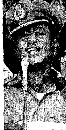
نمیری رئیس جمهوری سودان شوروی هدفی قوی تر از آزادی و شوروی است و شوروی را متهم کرد که وانجا زیرزمینی کار می کند و عداوتی ستیزان را در شوروی و اتیوپی تعلیم می دهد.

خرطوم- آسوشیئدپرس- «ناراحت» است، جعفر نمیسوری، رئیس جمهوری سودان، بزرگترین کشور آفریقا، در صحابه با آسوشیئدپرس گفت «ایالات متحده شوروی را از آزاده گذشته است که هر کاری می خواهد در این منطقه بکند.» وی گفت از خودداری ایالات متحده از ایفای نقش فعالانای در محدود کردن فعالیت شوروی در آفریقا، به خصوص در جنگ اوگانان بین سومالی و اتیوپی، سخط خواهد کرد. نمیری، که کسب نیروی بزرگترین ایالات متحده را تمام کرده است، گفت شوروی بعد از آنکه در سومالی توجیه خود را به سودان و کنتیا مسلوب خواهد کرد. زیادباره، رئیس جمهوری سومالی چندماه قبل در اقدامی ناگهانی مستشاران شوروی را از کشور خود اخراج کرد. وی پیش بینی کرد «کنتیا سقوط خواهد کرد. نمیری، برای مقابله با اقدامات احتمالی شوروی در سودان، از ایالات متحده یک اسکادران ۱۲ تایی هواپیمای جنگی «اف-۵» خواسته است که بپول آن را عربستان سعودی خواهد پرداخت. نمیری همچنین فلش کرد که برای خرید دو اسکادران جنگنده میزاد و یک سیستم دفاع هوایی با فرانسه مشغول مذاکره است. وی گفت بهای در نبردهای اخیر بیروت ۱۵۰ کشته شد.