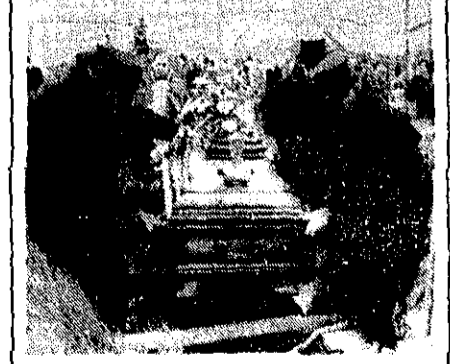
کپلر دفن شد

سلتو- خبرگزاری فرانسه- هربرت کپلر، سرهنگ پیشین «اس-اس» که روز پنجشنبه در ۷۰ سالگی مرد، دیروز در سلتو (واقع در آلمان غربی) به خاک سپرده شد. در حدود ۲۰۰ نفر تابوت او را تا گورستان شلیچ کردند. تابوت در گل های سفید و سبز غرق بود و یک دسته موزیک با نغمه های آهنگ من یک رفیق داشم را نواخت. در این مراسم یکی از اعضای پیشین لژیون «کندور» تاج گل و بنام ویران بشمار وزارت نیرومند دفاع هیتلر روی گور کپلر گذاشت و یک گروه ۱۵ نفری جوانان ضدفاشیسم او را هو کردند.