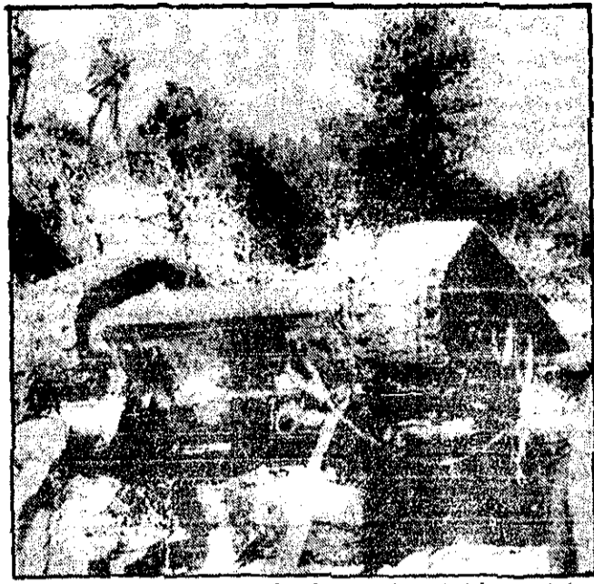
نیروهای اتیوپی در کنار تانک و از کون دشمنی که می گویند متعلق به نیروهای سومالی بوده، دیده می شوند. این عکس در جاده بین حرر و جیجکا در منطقه اوگانان گرفته شده است. (رادیوآزادی آسوشیئدپرس)

پاریس- خبرگزاری فرانسه- میان آمریکا و شوروی بر سر مسائل شاخ آفریقا نوعی سازش وجود دارد و رفتار اروپاییها در این زمینه هم از ضعف یا همدستی ناشی می شود. سفر سومالی در پاریس که این حرف را می زند، معتقد است که «همساز» شوروی و آمریکا به این دلیل ثابت می شود که واشنگتن سکوت را می گذارد تا آشکارا سیاست مدخله گزانه و استعمارگرانه خود را در منطقه بکار بندد. بمقیده سفر سومالی او ابروهای این قضیه به اروپا هم مثل سومالی مربوط می شود و اگر اروپاییان آن را در تک ننگند سینه اند، اما اگر آن را در تک ننگند و کاری نکنند همدست آمریکا و شوروی خواهند بود. از سوی دیگر «روزنامه خلق» چاپ پکن، دیروز شوروی را متهم کرد که در شاخ آفریقا نقش آفرینش بر سرعه گرفته است. ارگان حزب کمونیست چین خاطرنشان کرده که در طی ماههای اخیر یک «جریان نامحدود اسلحه و نقرات نظامی شوروی از راه هوا و دریا به این منطقه گسیل شده» و مسخره است که سخنگوی کرملین ادعا می کند که شوروی قهرمان خاموش کردن آتش میان دو کشور آفریقای در حال جنگ است.