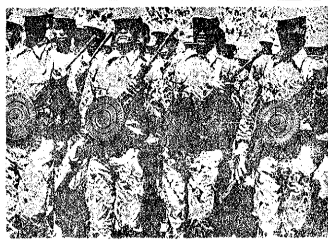
مدن ترین سلاحهای شوروی در دست سربازان آلبانی را در صحرای لوگان و در برابر نیروهای سوالی داده است - صفحه ۲ - ستون اول

بر اساس لایحه جدید بیمه بیکاری به بیکاران مستمری داده میشود