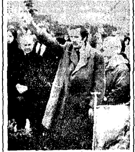
یکی از کسانی که در مراسم تدفین کپلر، رئیس سابق کشتیاب در دم سلام بازی می دهد. در عکس پایین تابوت کپلر در گور می گذارند.

خرطوم- آسوشیئدپرس- «ناراحت» است، جعفر نمیسوری، رئیس جمهوری سودان، بزرگترین کشور آفریقا، در صحابه با آسوشیئدپرس گفت «ایالات متحده شوروی را از آزاده گذشته است که هر کاری می خواهد در این منطقه بکند.» وی گفت از خودداری ایالات متحده از ایفای نقش فعالانای در محدود کردن فعالیت شوروی در آفریقا، به خصوص در جنگ اوگانان بین سومالی و اتیوپی، سخط خواهد کرد. نمیری، که کسب نیروی بزرگترین ایالات متحده را تمام کرده است، گفت شوروی بعد از آنکه در سومالی توجیه خود را به سودان و کنتیا مسلوب خواهد کرد. زیادباره، رئیس جمهوری سومالی چندماه قبل در اقدامی ناگهانی مستشاران شوروی را از کشور خود اخراج کرد. وی پیش بینی کرد «کنتیا سقوط خواهد کرد. نمیری، برای مقابله با اقدامات احتمالی شوروی در سودان، از ایالات متحده یک اسکادران ۱۲ تایی هواپیمای جنگی «اف-۵» خواسته است که بپول آن را عربستان سعودی خواهد پرداخت. نمیری همچنین فلش کرد که برای خرید دو اسکادران جنگنده میزاد و یک سیستم دفاع هوایی با فرانسه مشغول مذاکره است. وی گفت بهای در نبردهای اخیر بیروت ۱۵۰ کشته شد.