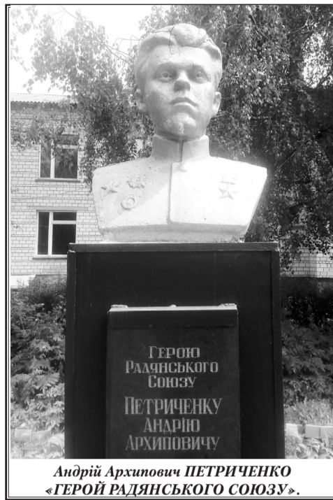
Андрій Архипович ПЕТРИЧЕНКО «ГЕРОЙ РАДЯНСЬКОГО СОЮЗУ».

Ухвалою Військової колегії Верховного суду СРСР від 2 серпня 1950 р. вирок Військового трибуналу Південно-Західного фронту скасували, і справу генерала направили на нове розслідування, після чого він був повторно засуджений Військовою колегією Верховного суду СРСР 26 серпня 1950 р. і засуджений до вищої міри покарання. Того ж дня П.Д.Артемьєнка розстрі-