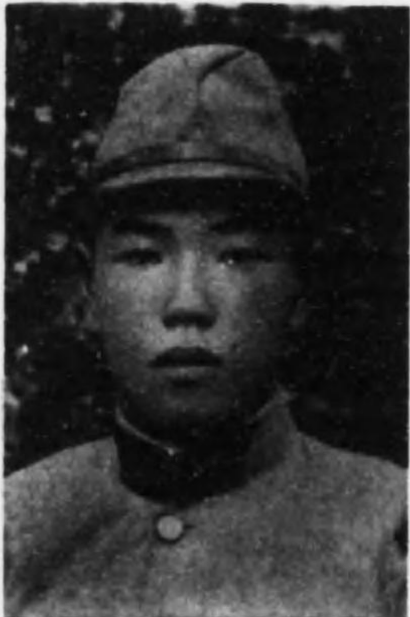
君吉正 賀石 兵等上兵步故