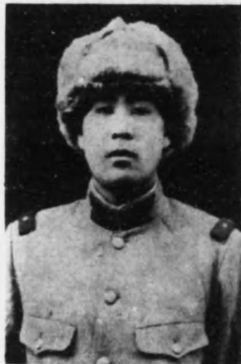
君信哲 内山 兵等上兵步故