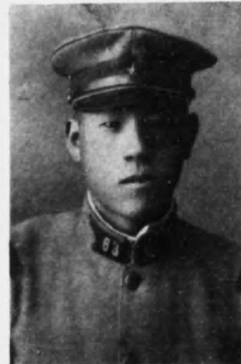
君喬 木細 兵等上兵步故