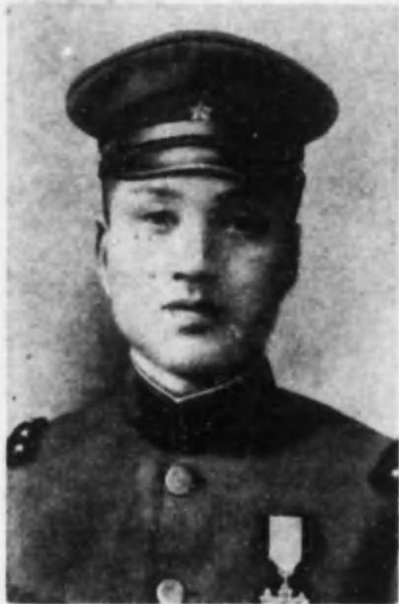
君一彰林立 兵等上兵重輻故