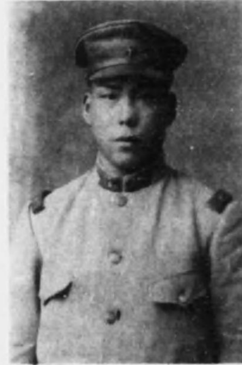
君實 野牧 兵等上兵步故