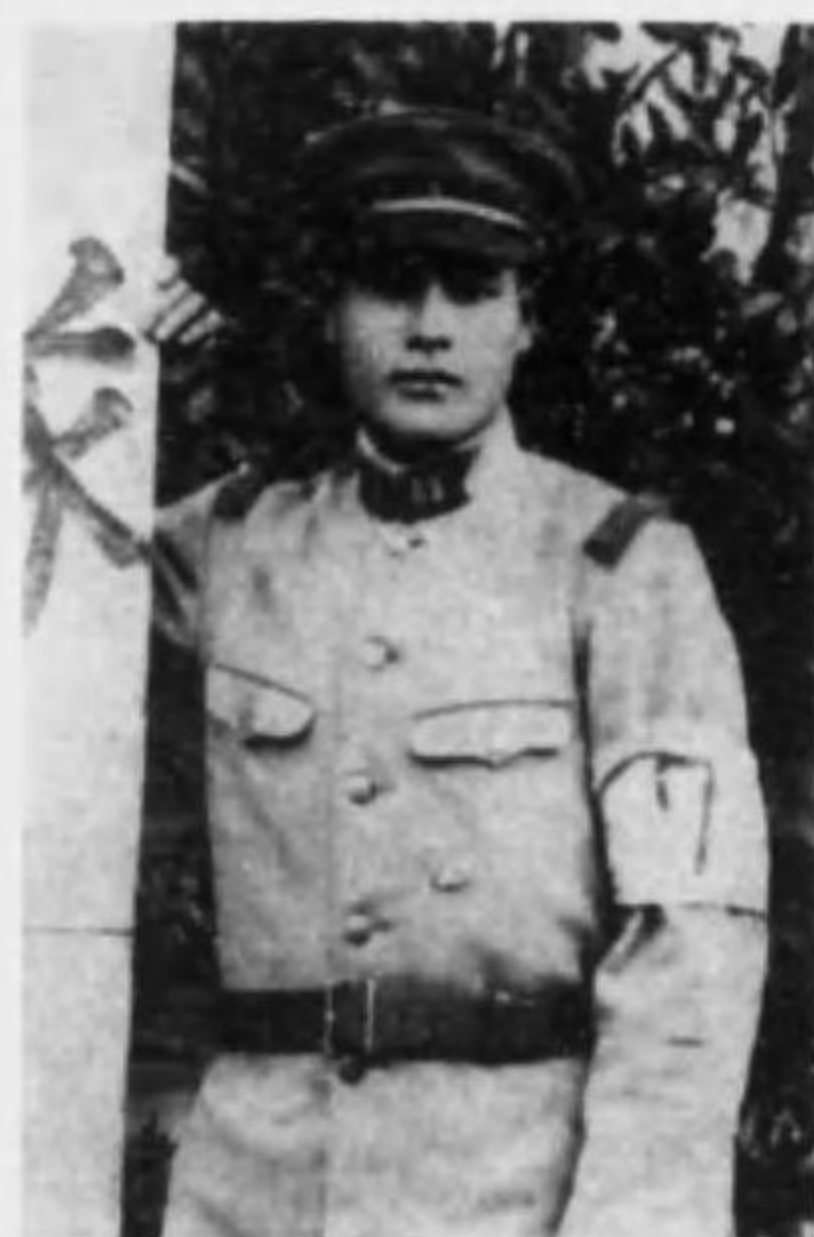
君謙 木 齋 兵等上兵步故