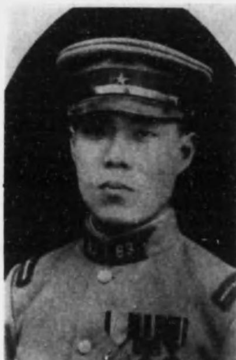
君弘好 尾中 長伍兵步故