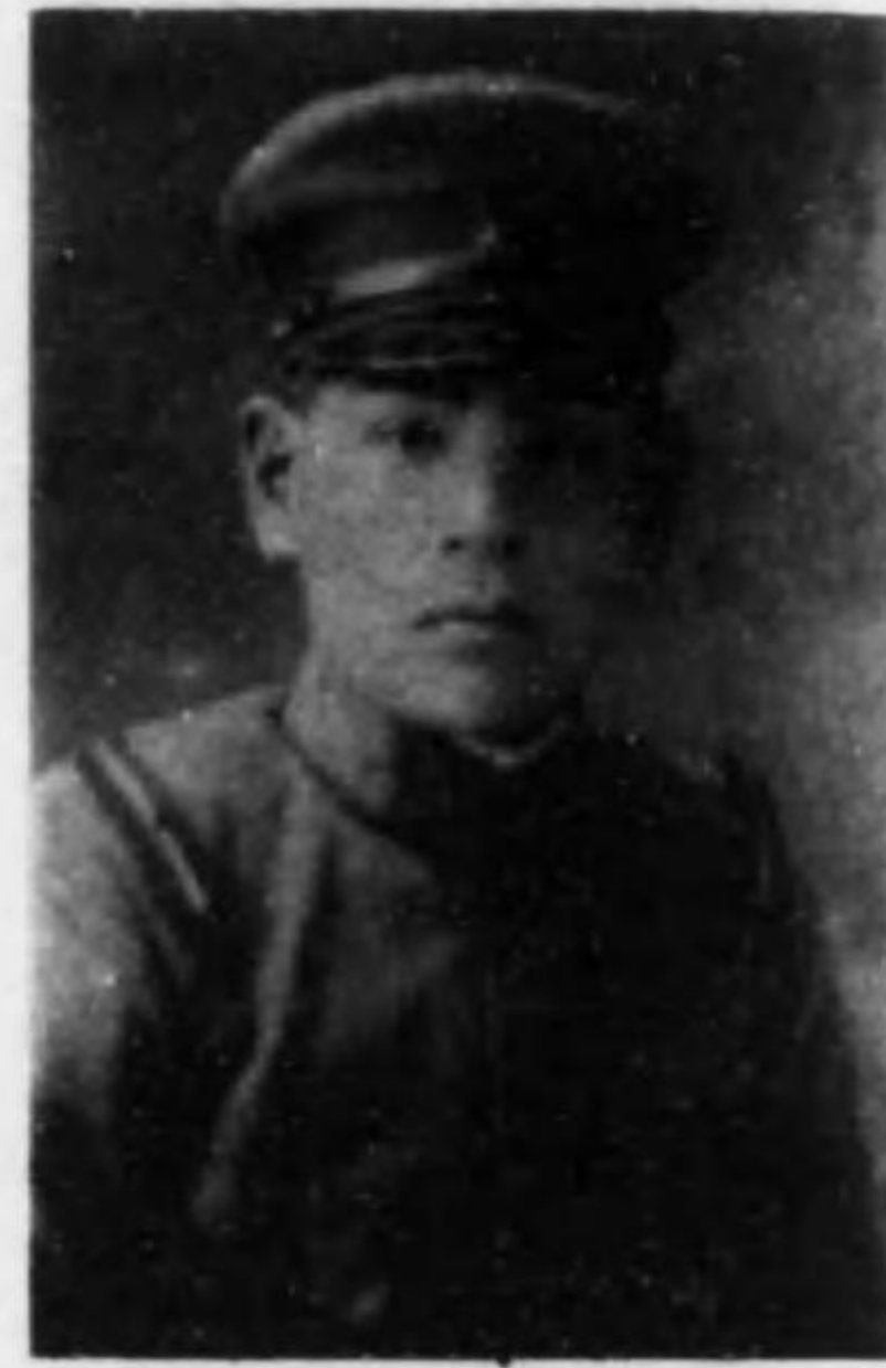
君賢 幡八 曹軍兵步故