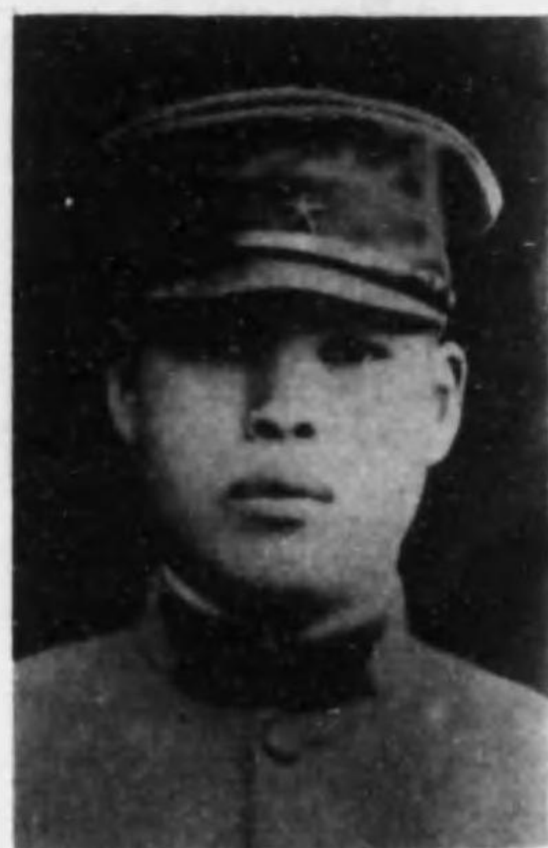
君助義 田深 兵等上兵步故