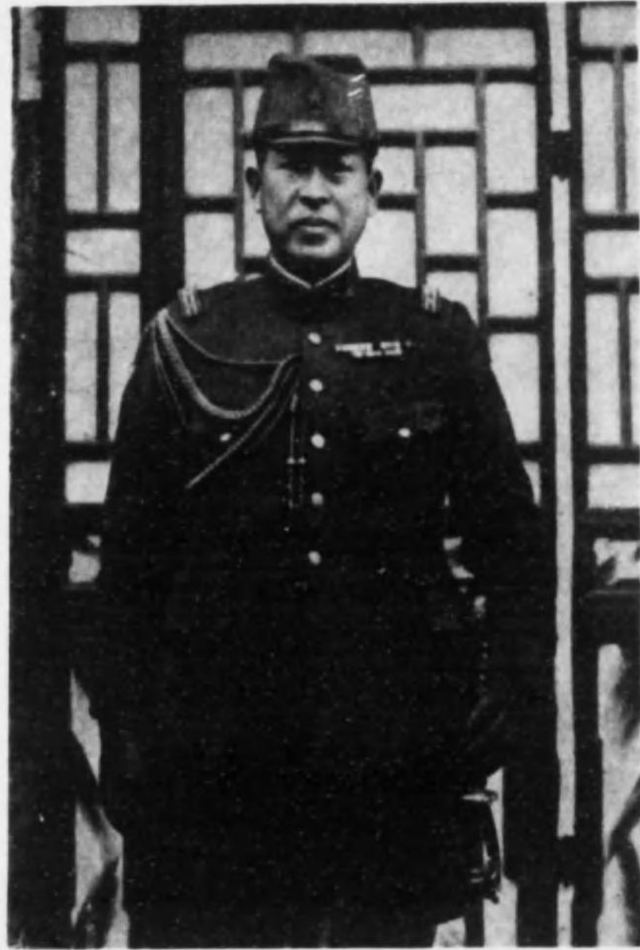
故 陸 軍 少 將 村 久 藏 閣 下