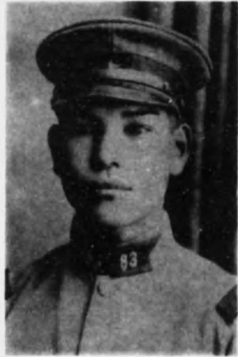
君順 川野 長伍兵步故