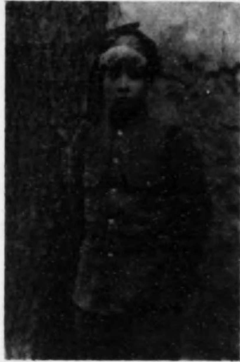
君夫美壽部宮 兵等上兵步故