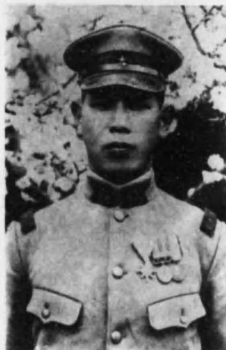
君直政 原石 兵等上兵步故