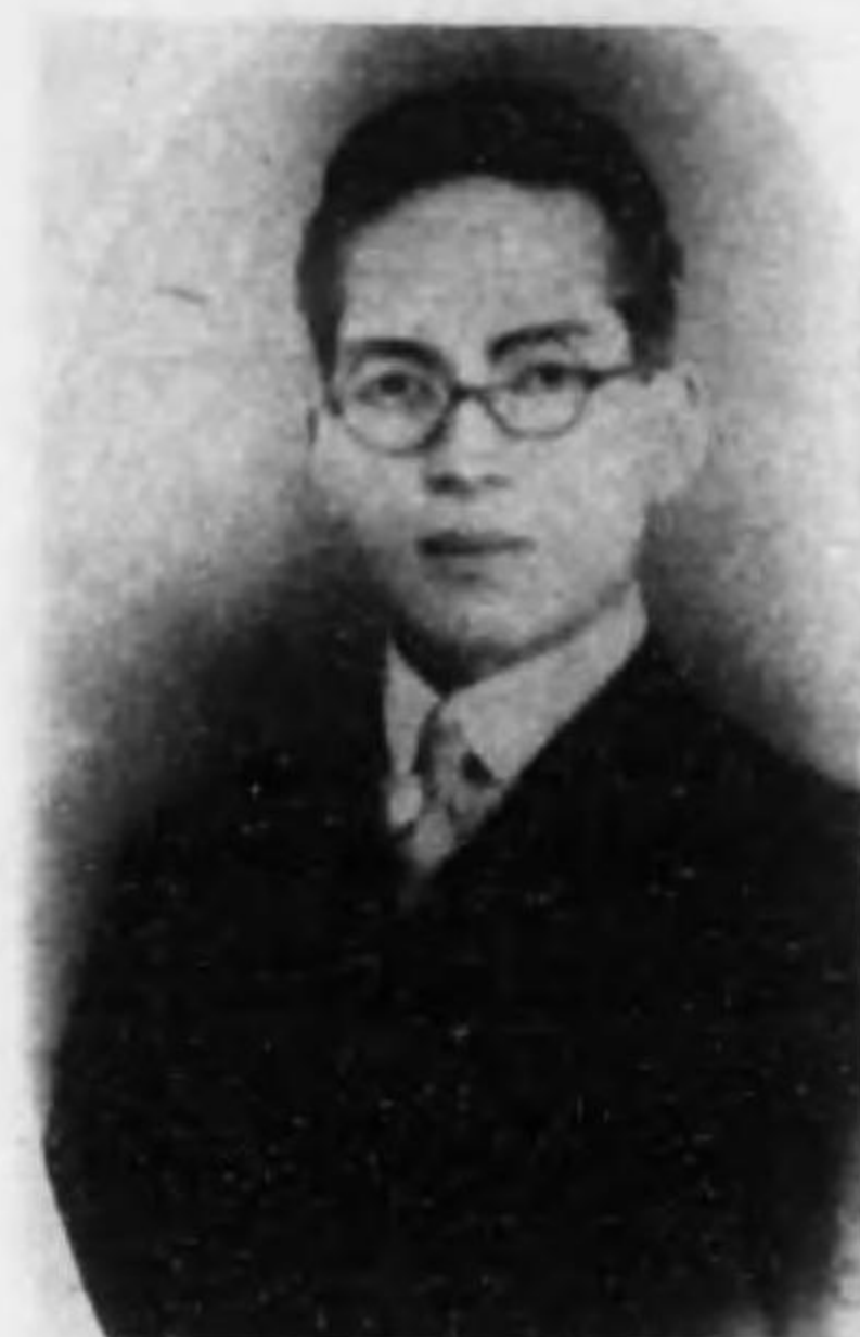
君郎次虎野矢 屬 軍 故