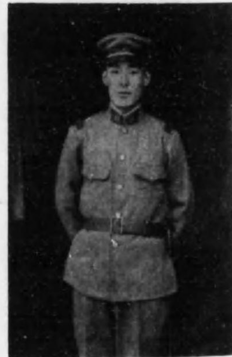
君人正 田砂 兵等上兵步故