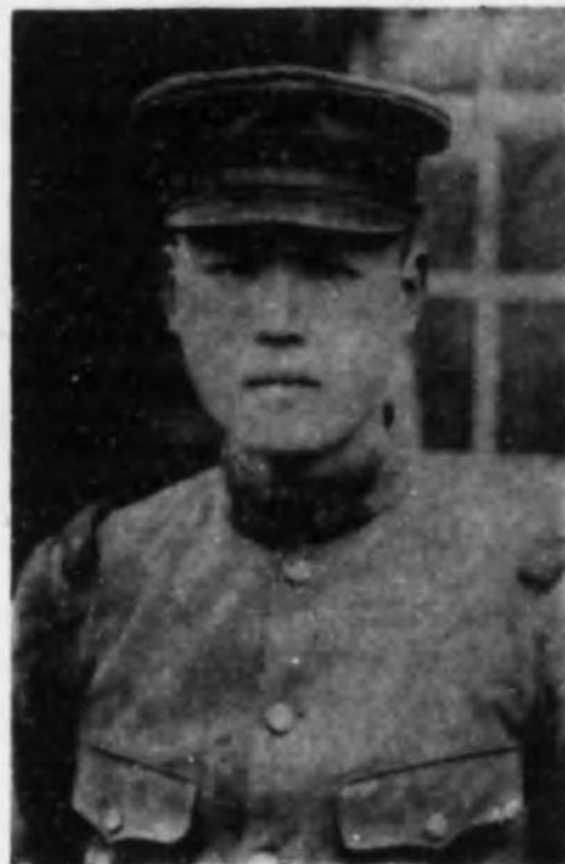
君茂 岡安 兵等上兵步故