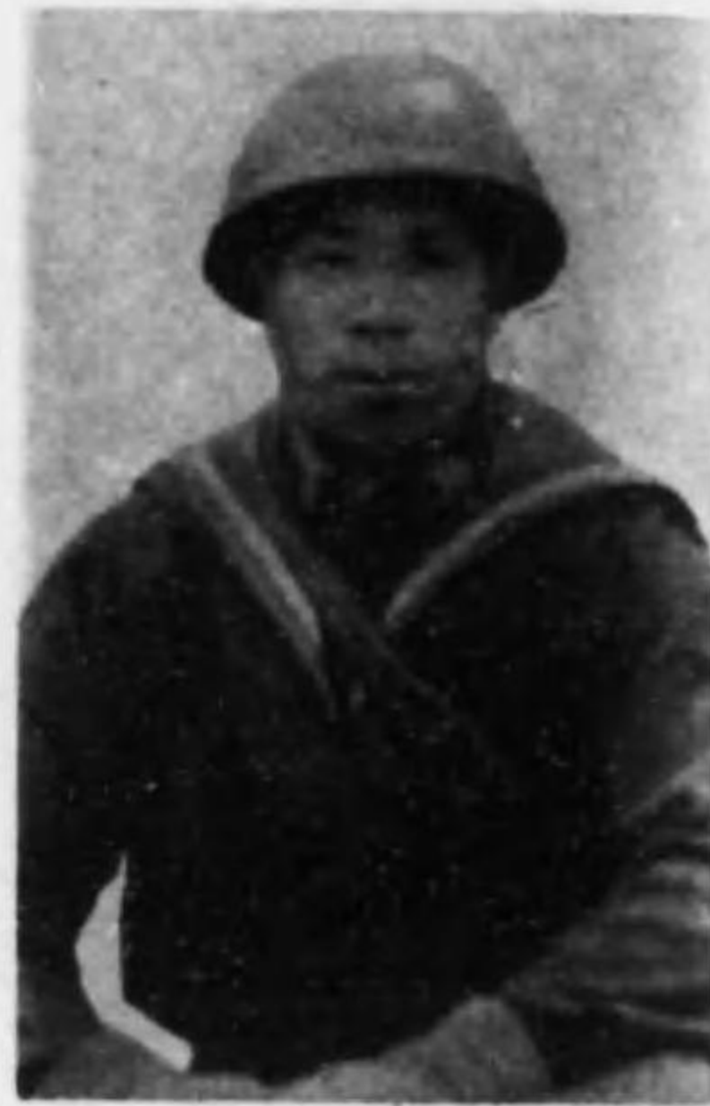
君榮一 本門 兵關機等二故