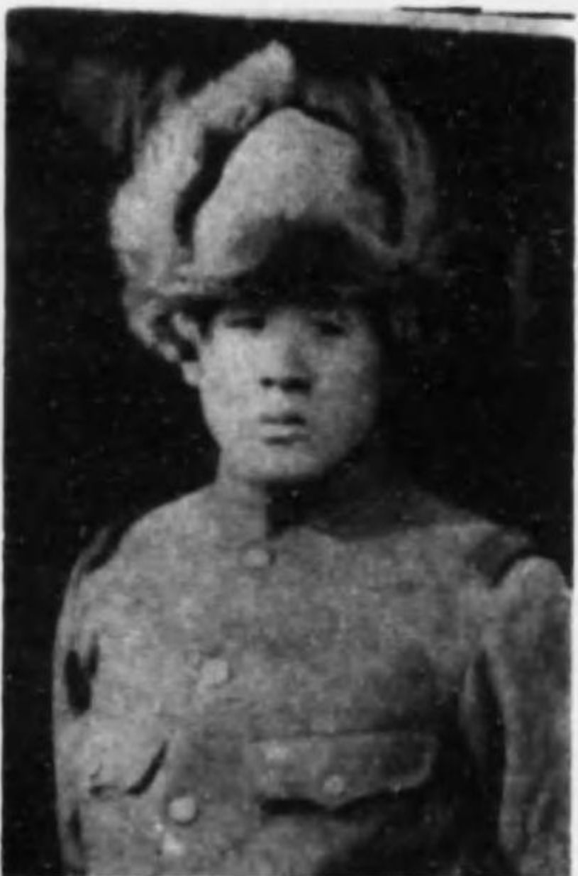
君三孝 山益 兵等上兵步故