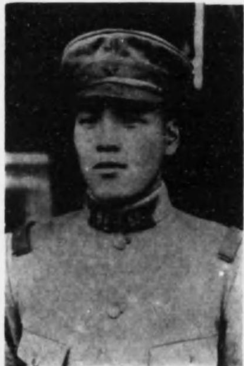
君助之清江入 兵等上兵步故