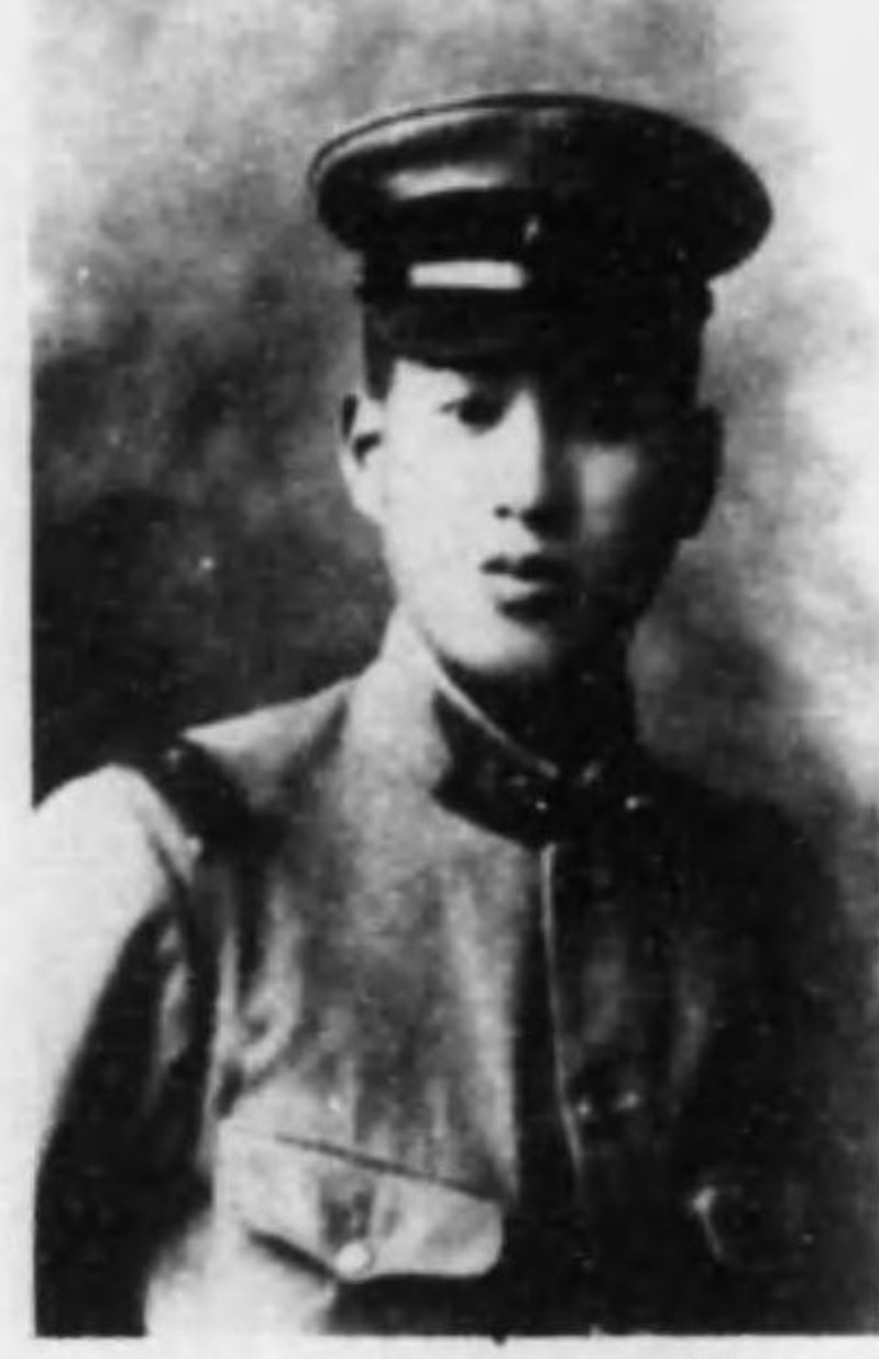
君春壽 邊渡 兵等一兵步故