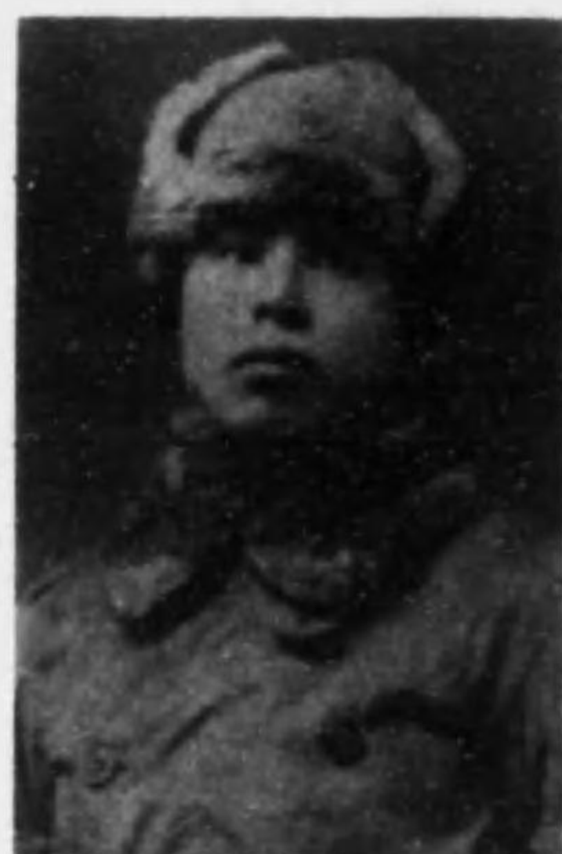
君助之忠井荒 長伍兵步故