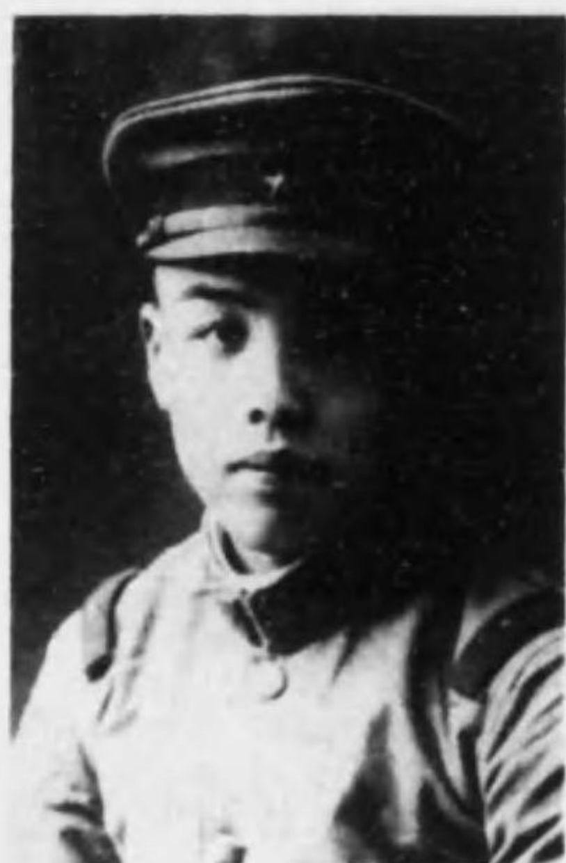
君勝 田 津 兵等上兵步故