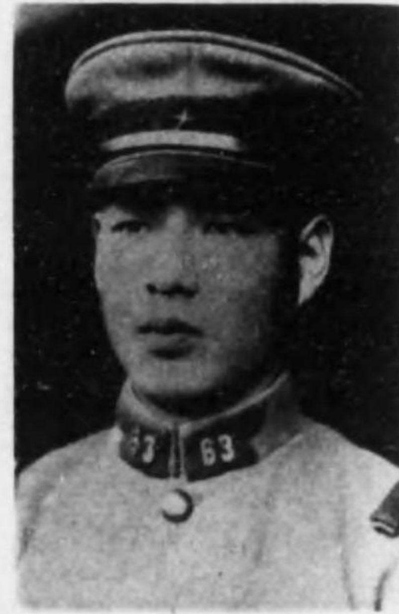
君一尙 上浦 兵等上兵步故