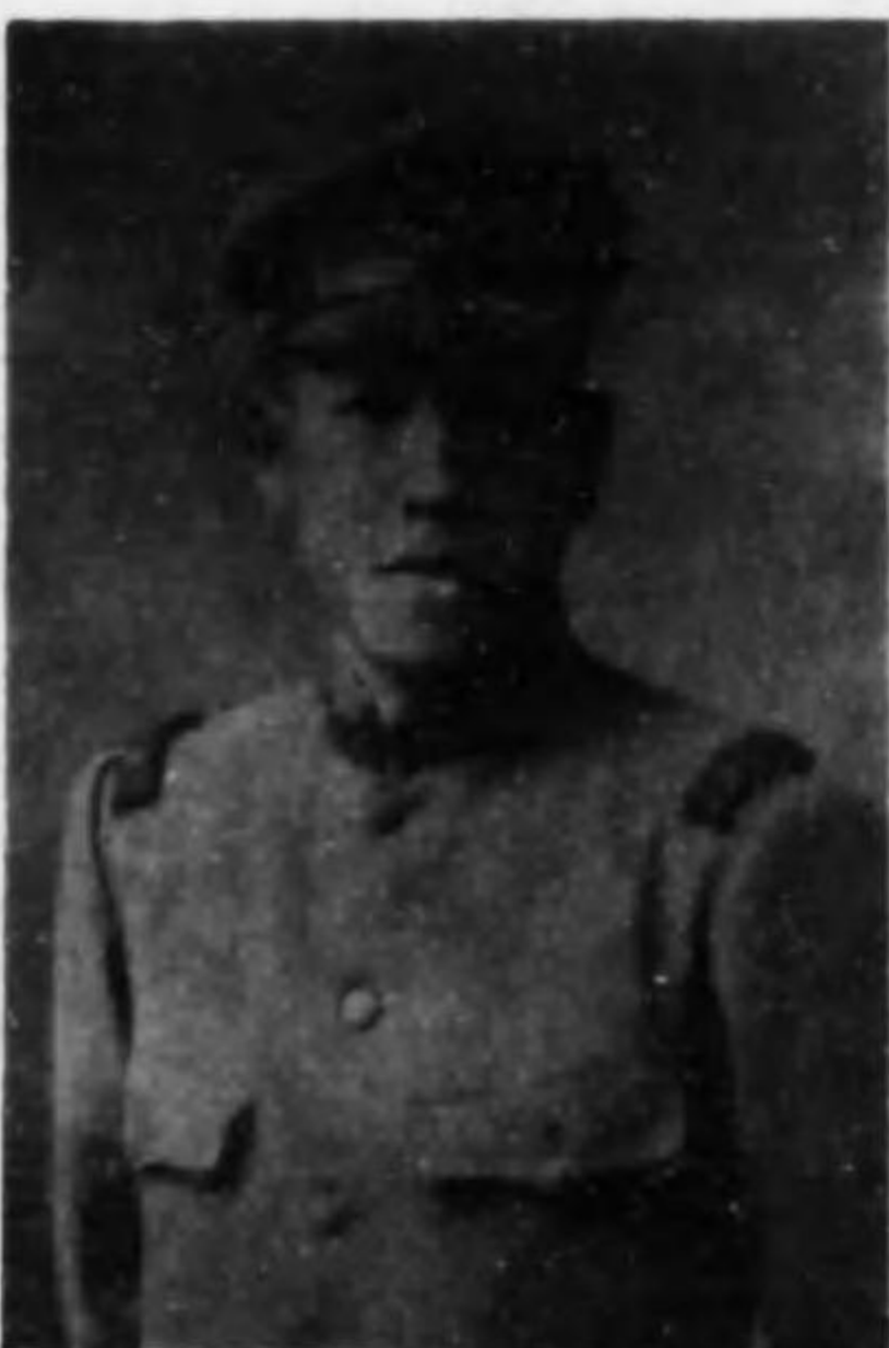
君行昌 木齋 兵等上兵步故