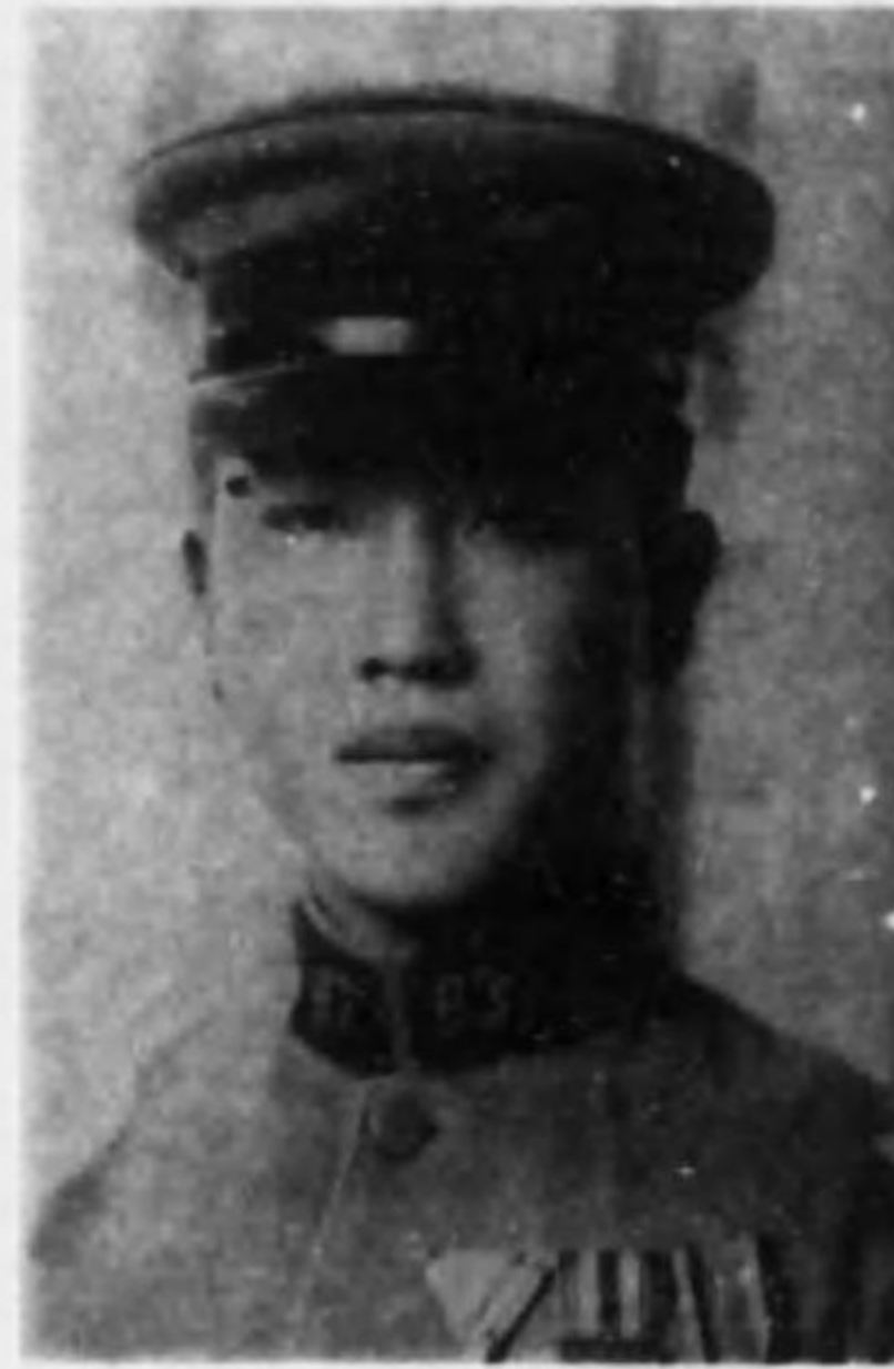
君二正 本景 兵等上兵步故