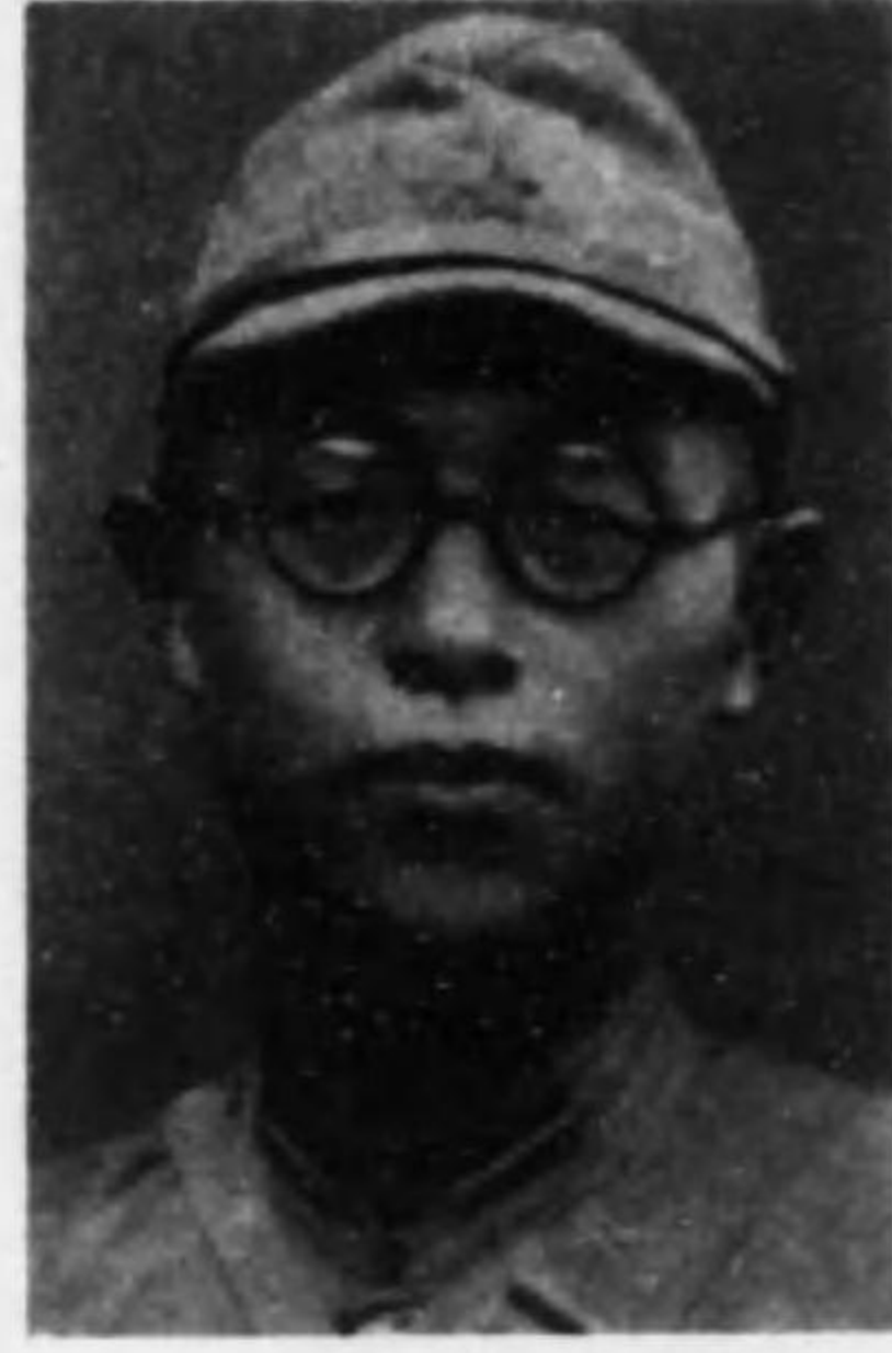
君勇 林小 長兵軍陸故