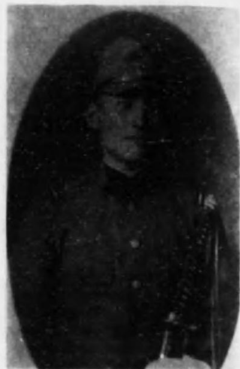
君二良 見板 尉大兵步故