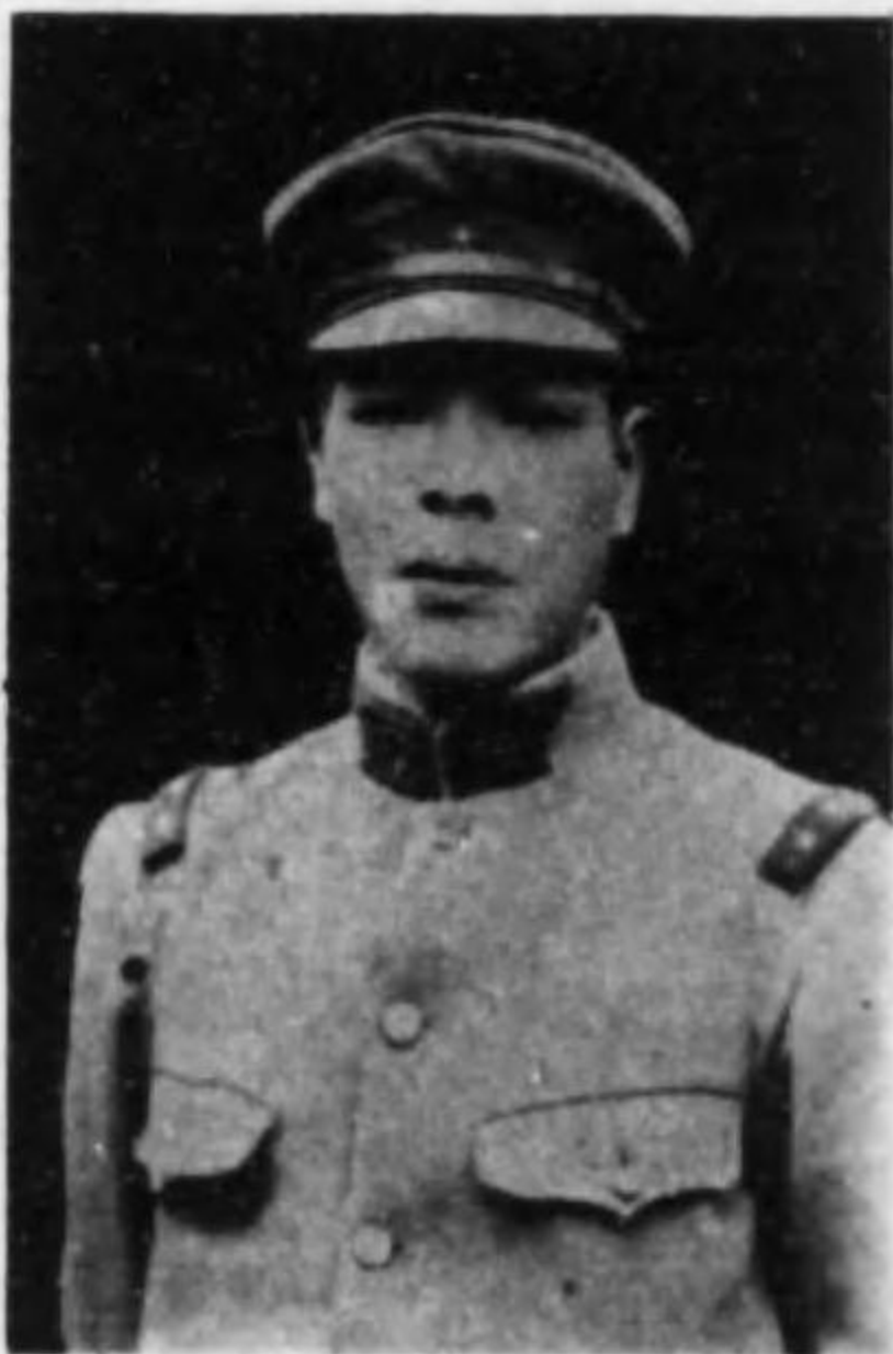
君忠 田 岡 兵等上兵步故