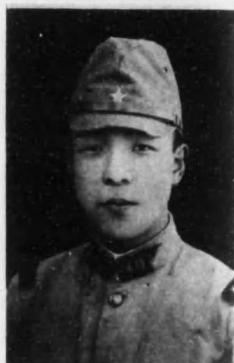
君實 中 田 長伍兵步故