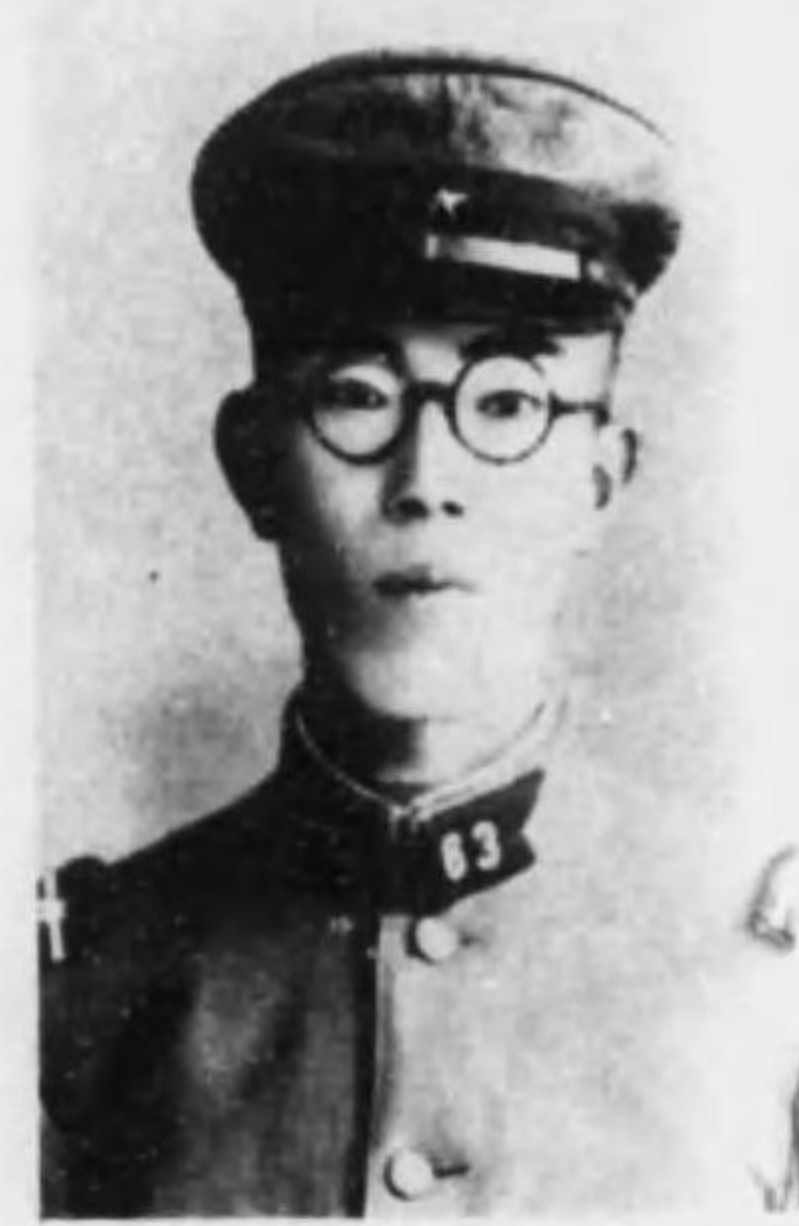
君登美 信池 長伍生衛故