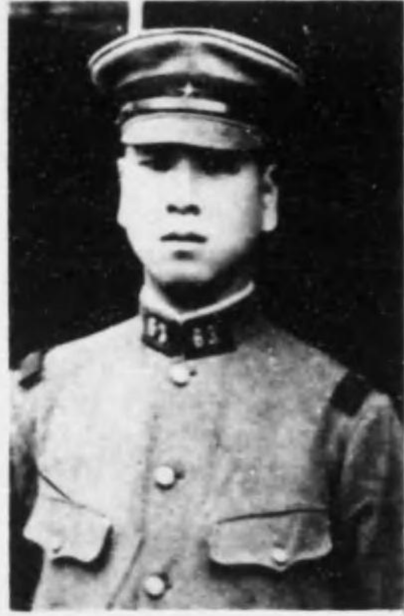
君治忠 鳥三 長曹兵步故