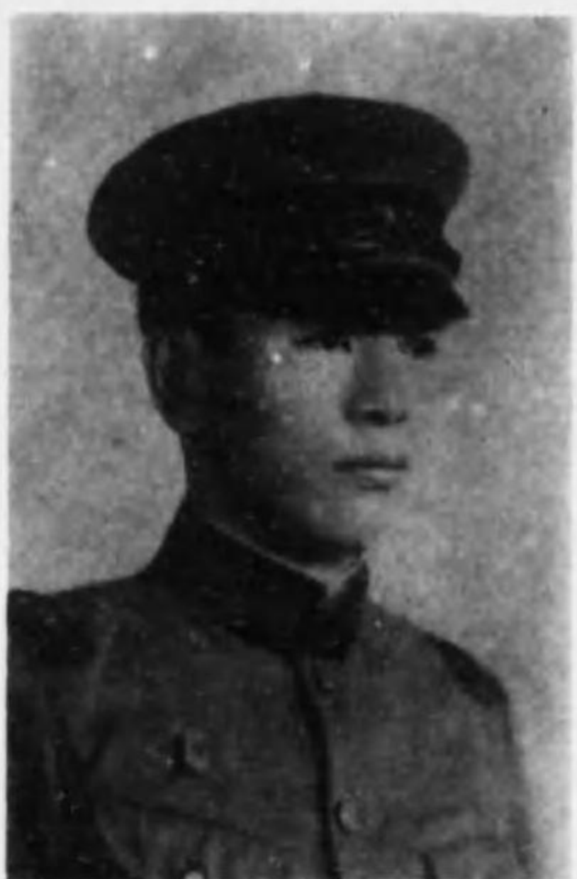
君雄一 遊諸 兵等上兵步故