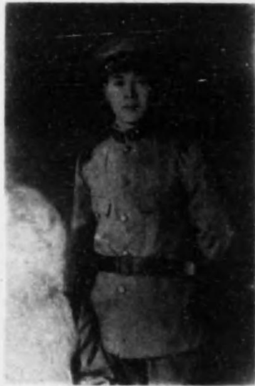
君美義崎和 兵等二務特兵重輸故