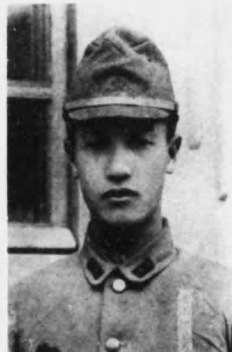
君男英 口山 長伍生衛故