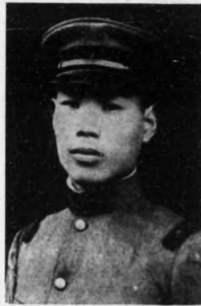
君雄繁 口谷 兵等上兵步故