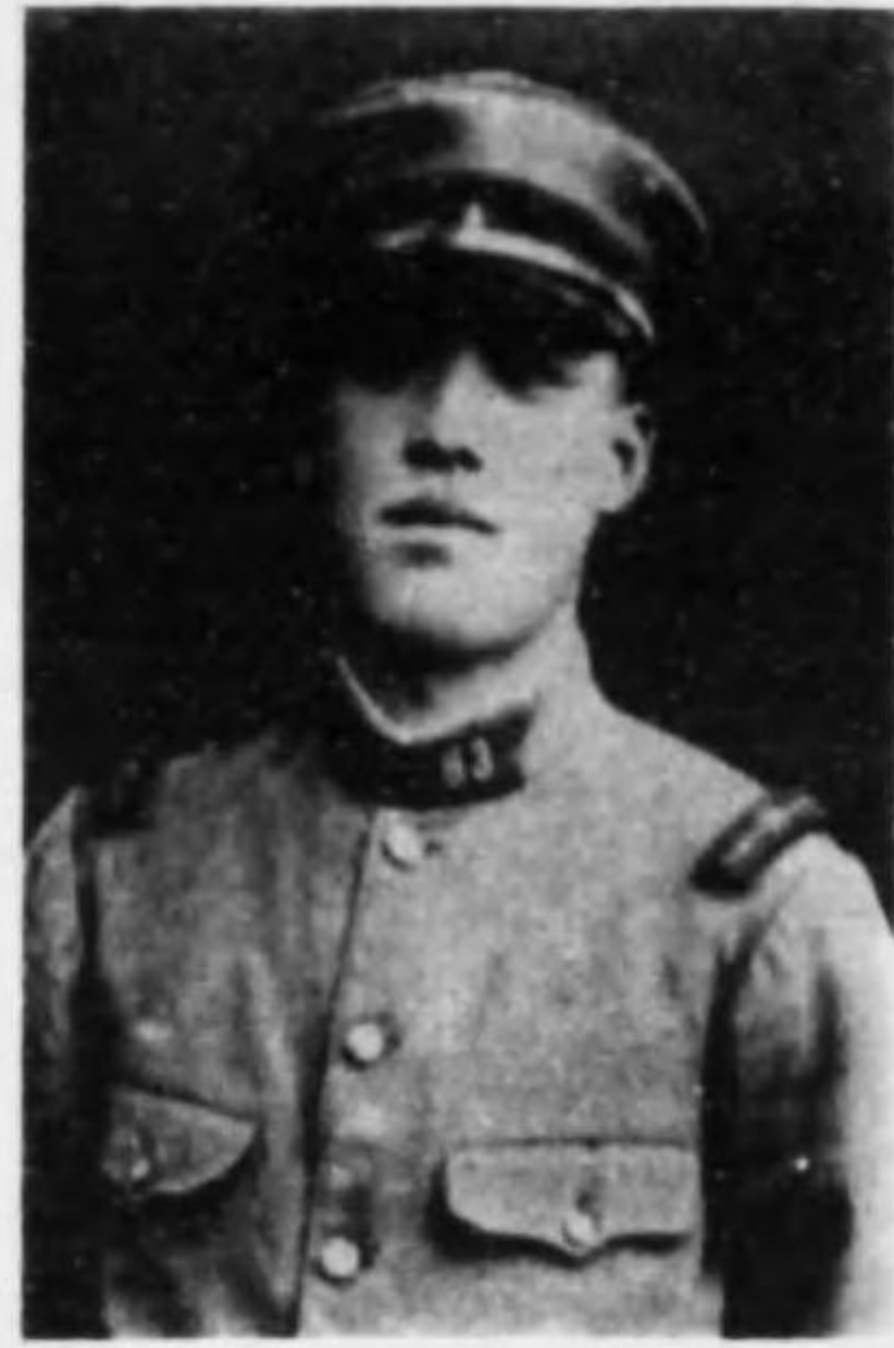
君幸 灘崎 曹軍兵步故