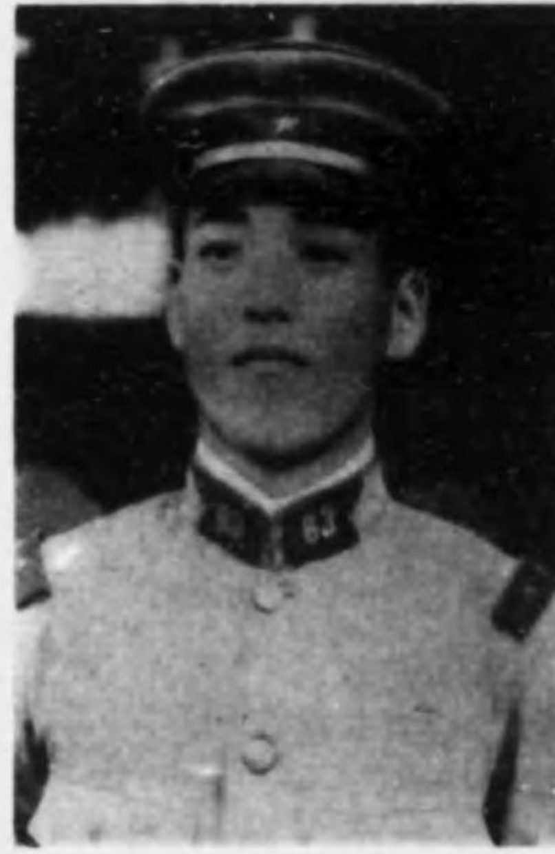
君治載 崎金 兵等上兵步故