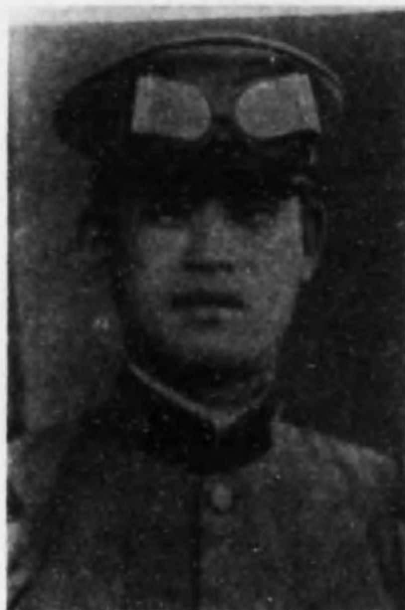
君滿 川 瀬 兵等上兵步故