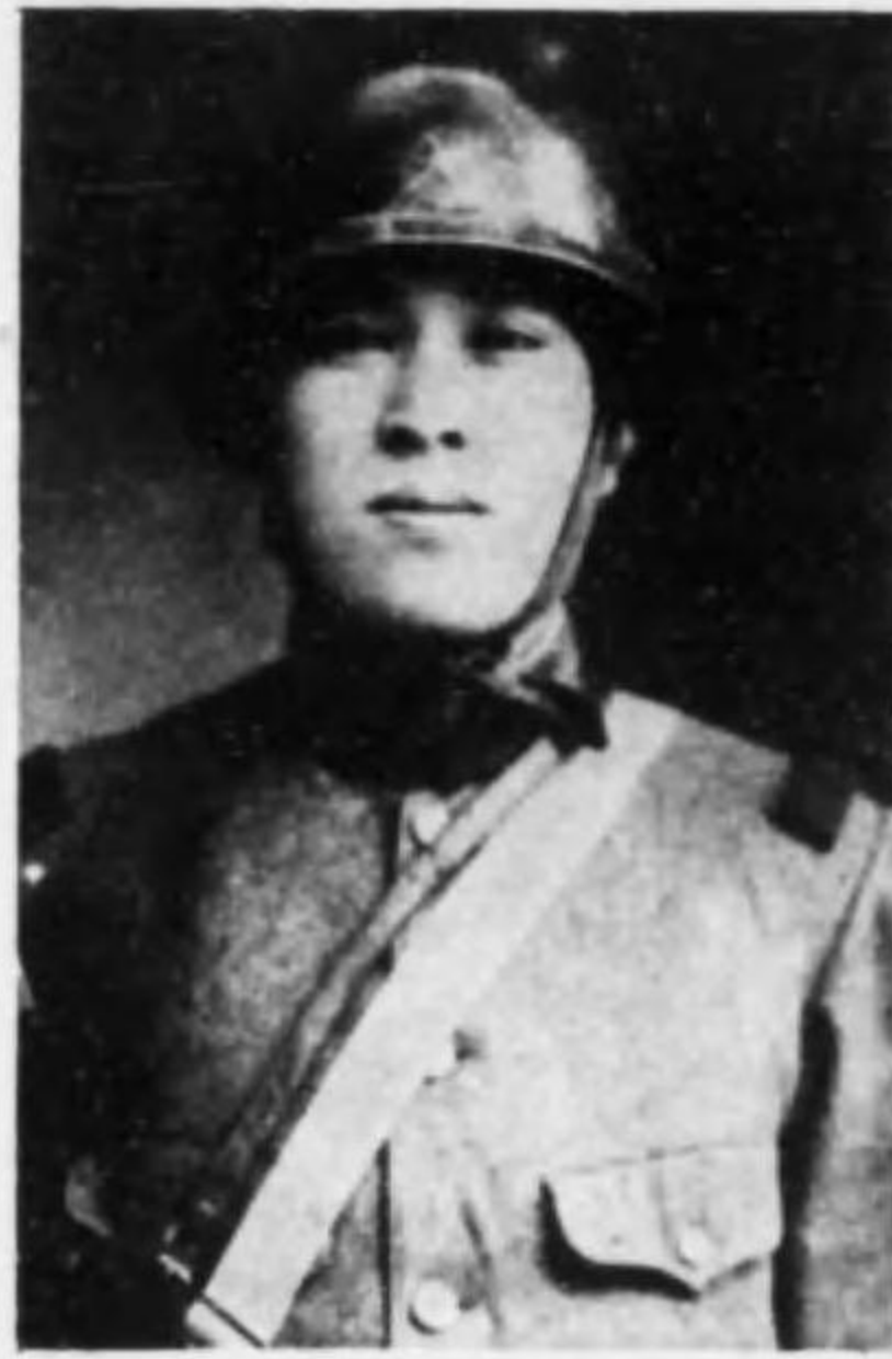
君春清 本松 兵等上兵步故