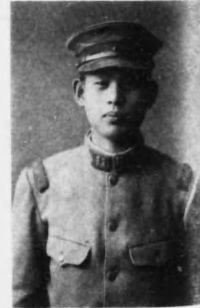
君二康 田住 兵等一兵步故

[Faint, illegible text on the right page]