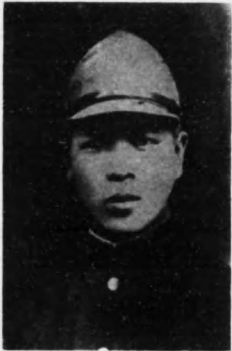
君進 森 兵等上兵步故