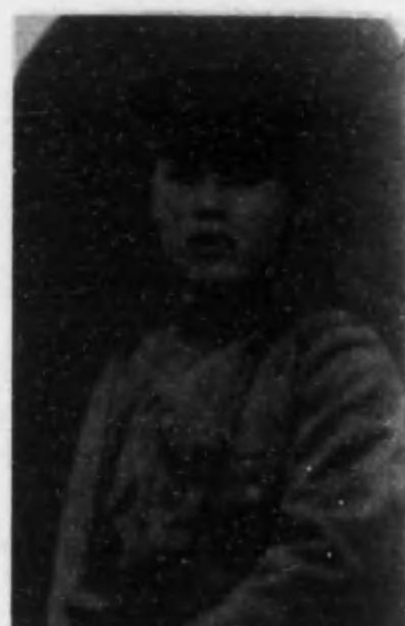
君明勅谷竹 兵等上兵重輻故