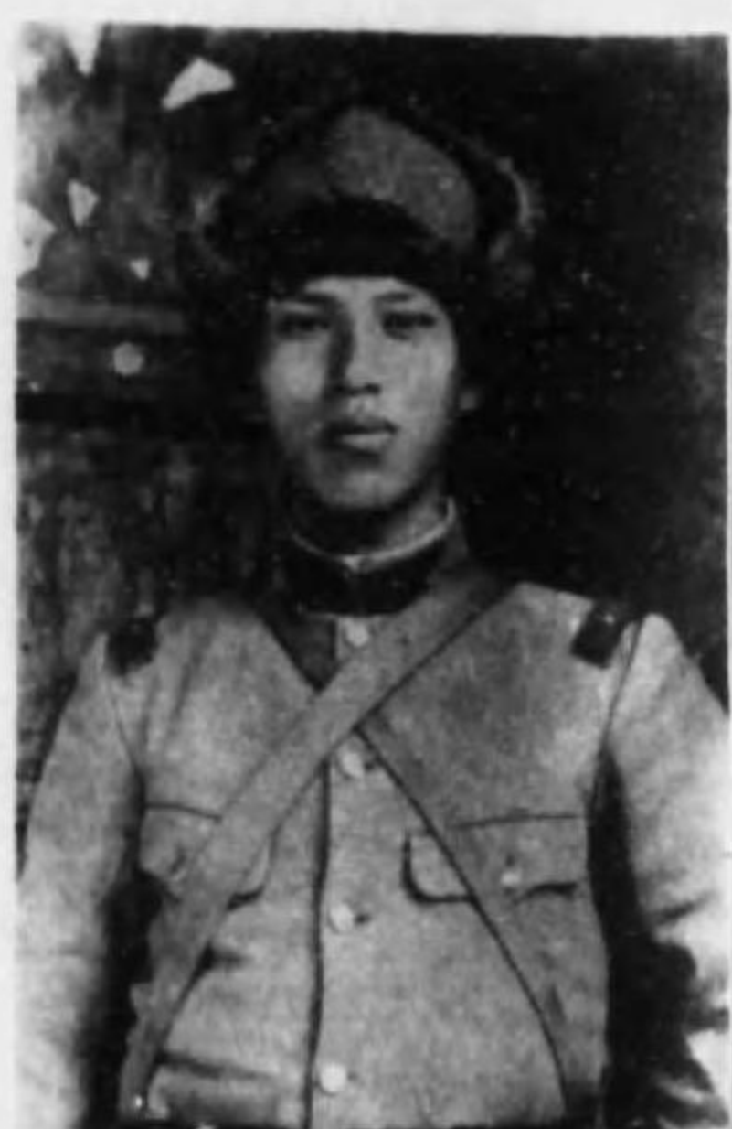
君清 飛 石 兵等上兵步故