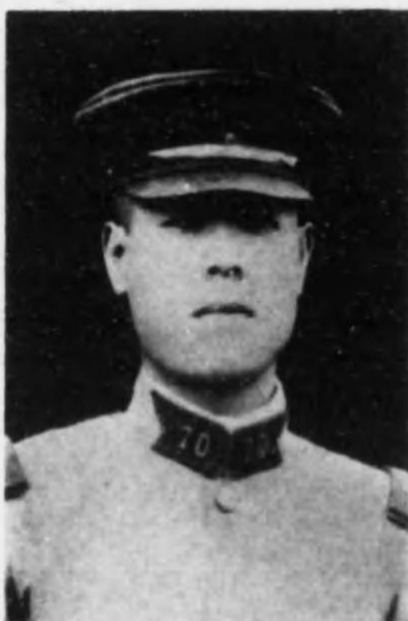
君郎太西村西 兵等上兵步故