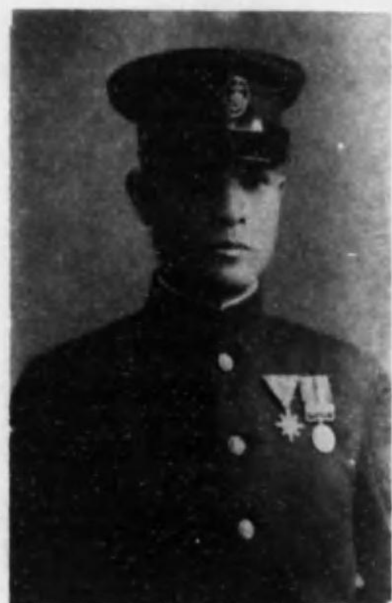
君郎三爲村田 長曹兵作工故