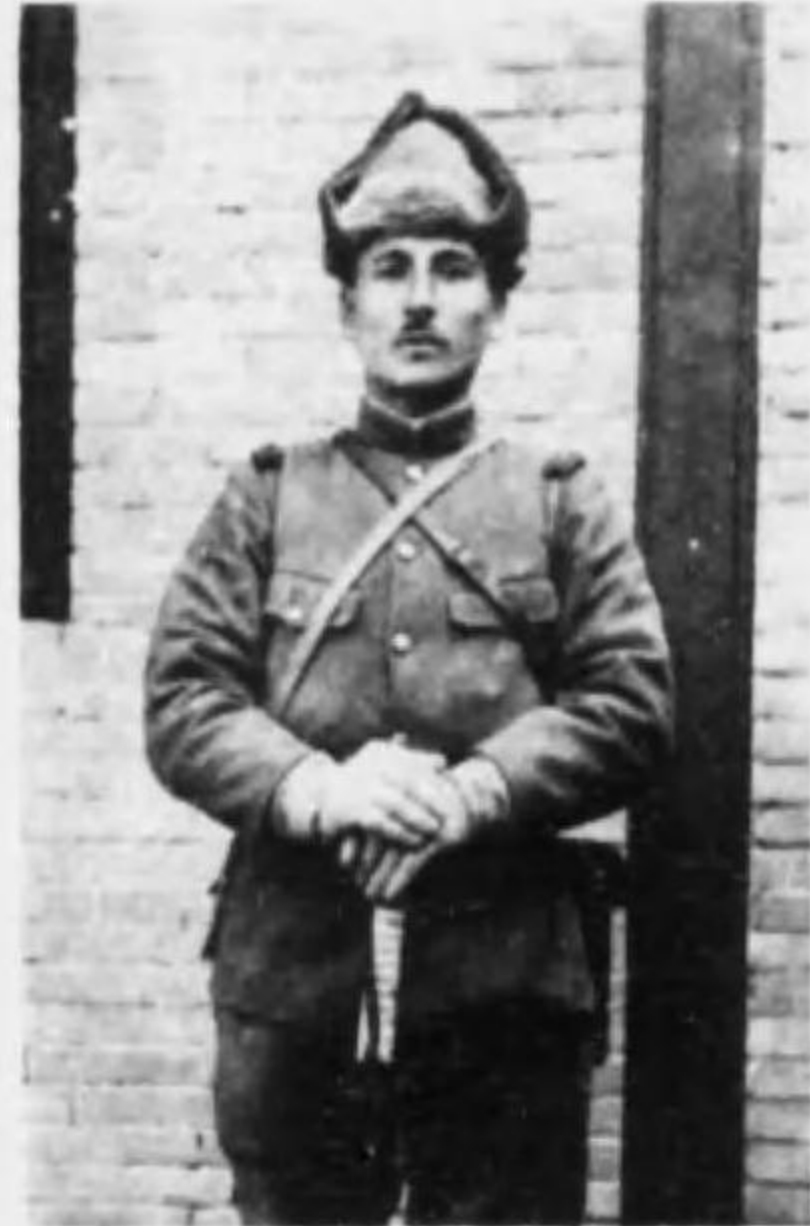
君郎三仁山住 長曹兵步故