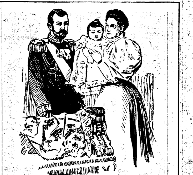
Les Souverains Russes goûtant les douceurs de la vie familiale.