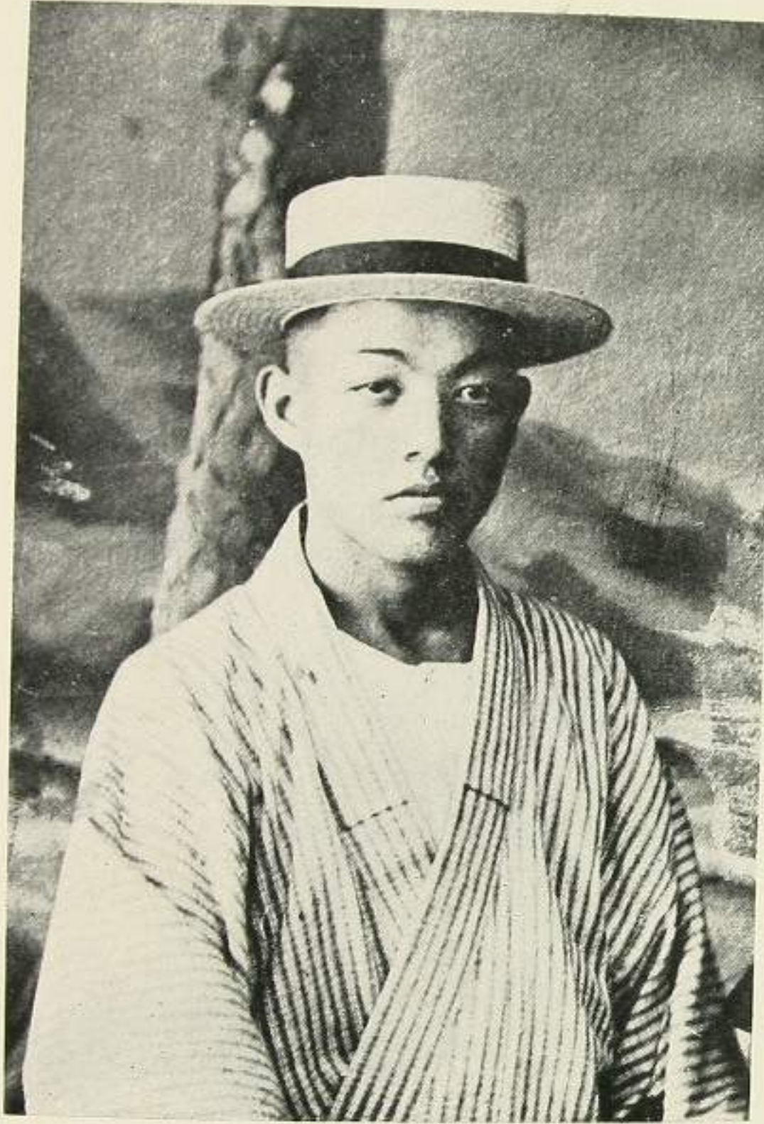
吉 米 倉 松 故