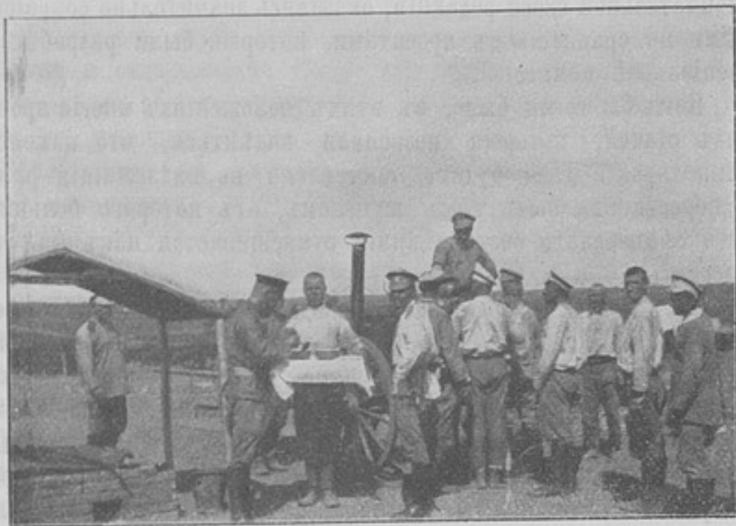
Изъ походной жизни въ Русско-Японскую войну. У походной кухни на бивакѣ.

дѣнія отдѣльно, то Главному Штабу придется только свести въ одно цѣлое итоги по округамъ, это конечно значительно легче, а потому такъ и дѣлается.