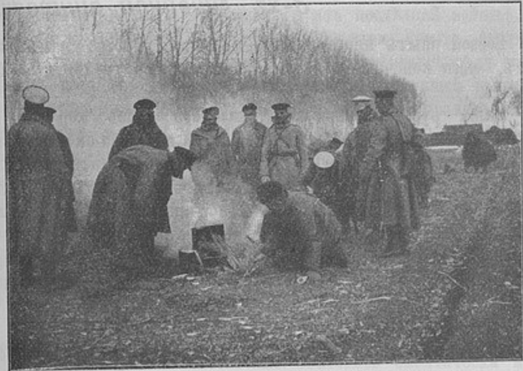
Изъ походной жизни въ Русско-Японскую войну. На походѣ. Биванъ 3-й батареи 29-й арт. бригады.

На обратной сторонѣ билета помѣщены свѣдѣнія о туберкулезѣ, пьянствѣ и венерическихъ болѣзняхъ.