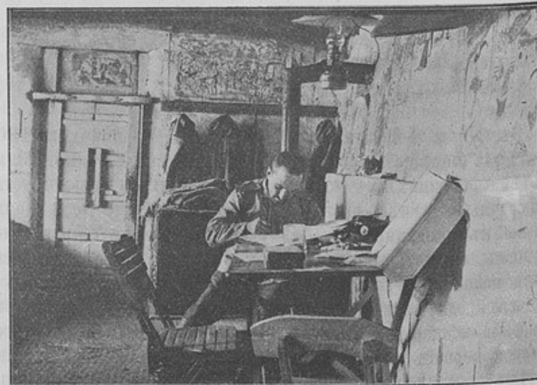
Изъ походной жизни въ Русско-Японскую войну. На зимнихъ квартирахъ. Офицерская фанза.