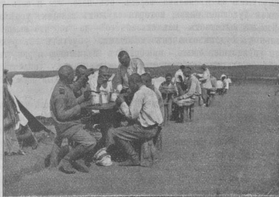
Изъ походной жизни въ Русско-Японскую войну. За обѣдомъ 3-я батарея 29-й арт. бригады.

эта всецѣло можетъ быть выполнена окружнымъ штабомъ, такъ какъ всѣ нужныя данныя въ штабѣ имѣются.