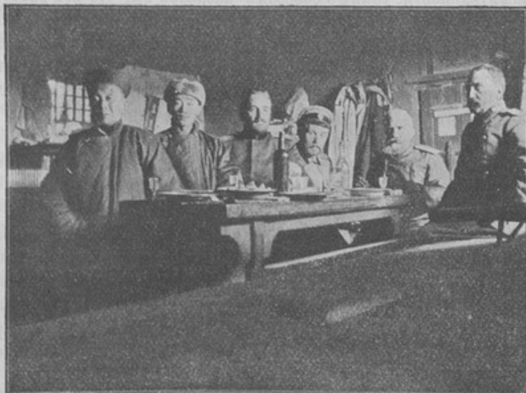
Изъ походной жизни въ Русско-Японскую войну. Гости 3-й батареи 29-й арт. бриг.

Обязанность распредѣленія войскъ для лѣтнихъ занятій, согласно ст. 17 кн. II С. В. П., лежитъ на главномъ начальникѣ военного округа; отсюда прямое и очевидное слѣдствіе, что проектъ лѣтнихъ сборовъ долженъ составляться въ окружномъ штабѣ; между тѣмъ составленіе этого проекта возложено на штабы корпусовъ и отдѣльныхъ дивизій и бригадъ, а этими послѣдними на отдѣльныя войсковыя части. На практикѣ работа сводится вотъ къ чему: окружной штабъ даетъ самыя точныя указанія—гдѣ, въ какое время и какія части должны отбывать лагерные сборы какъ частныя, такъ общіе и спеціальныя, но не въ формѣ проекта сборовъ, а отдѣльнымъ предписаніемъ. Безъ этого указанія и приступить къ составленію проекта невозможно. Низшимъ инстанціямъ предстоитъ затѣмъ внести текстъ предписанія окружного штаба въ вѣдомость по опредѣленной формѣ, а далѣе составить рядъ приложений, т. е. сдѣлать цифровыя вычисленія, исходя изъ штатнаго состава частей (количество суточныхъ денегъ, стоимость палатокъ и т. д.). Не подлежитъ сомнѣнію, что работа