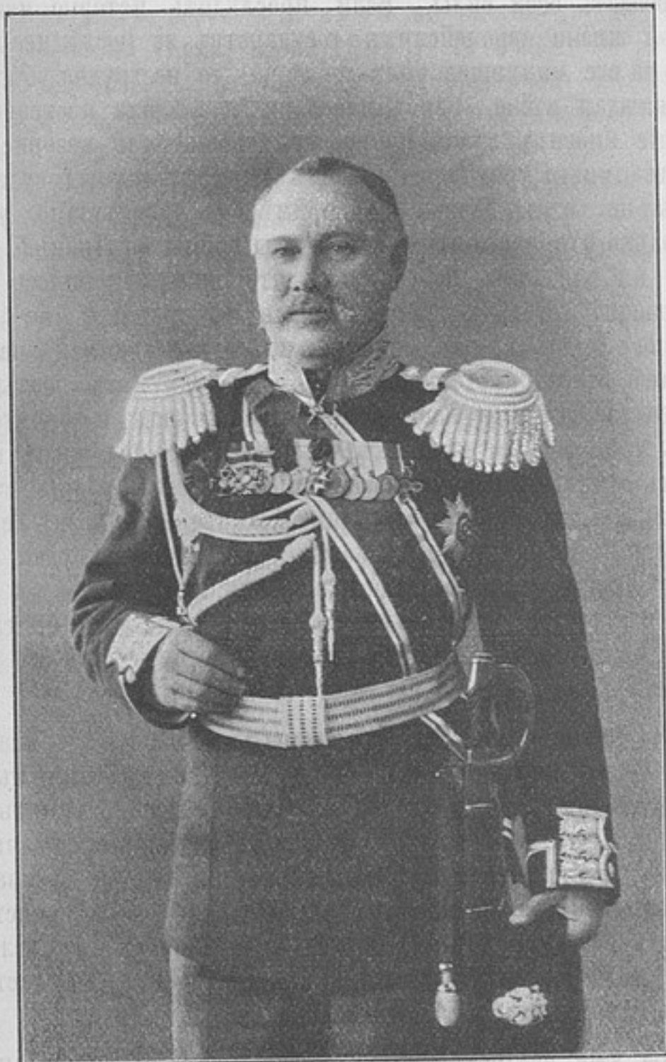
Начальникъ 44-й пѣхотной дивизіи, генераль-лейтенантъ